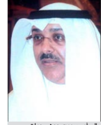
السفير سميح جوهر حيات

قام بها إلى البلاد أخيرا، مؤكدا أنه بعد نظر وتعبير عن خبرة طويلة في هذا المجال». وذكر مندوكوتي أن حصيلة زيارته إلى الكويت كانت مثمرة وإيجابية جدا وأنه قام على هامسها بزيارة أرض المعارض في منطقة مشرف وأن ما رآه من رقي وما لمس من اهتمام ورعاية بالغة من طرف الحكومة الكويتية ورؤيتها الاستراتيجية الثاقبة والجادة بتوسيع علاقاتها الدولية والتجارية وتقويتها عن طريق الاهتمام بتنظيم المعارض الدولية وفتح أسواق جديدة واعدة للشركات ورجال الأعمال الكويتيين «زاد من عزمته على الإصرار في المضي قدما بخطى ثابتة لإقامة هذا المعرض».