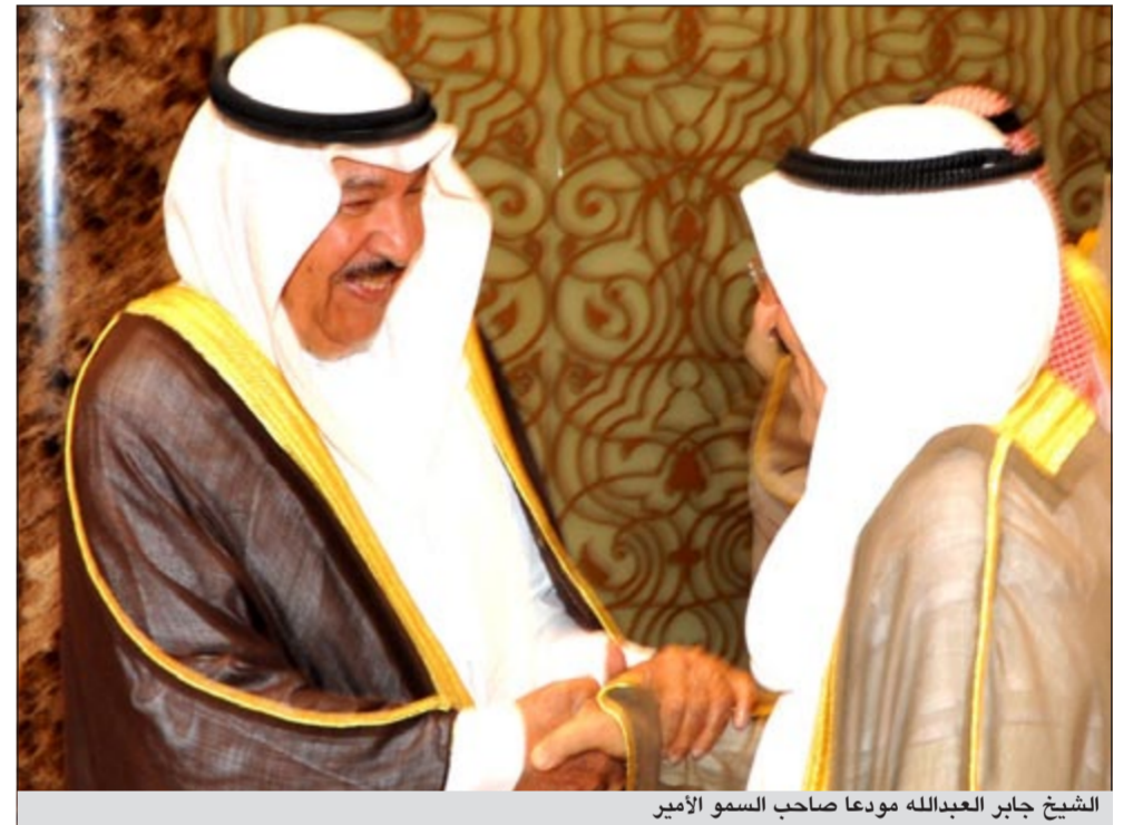
الشيخ جابر العبدالله مودعا صاحب السمو الأمير