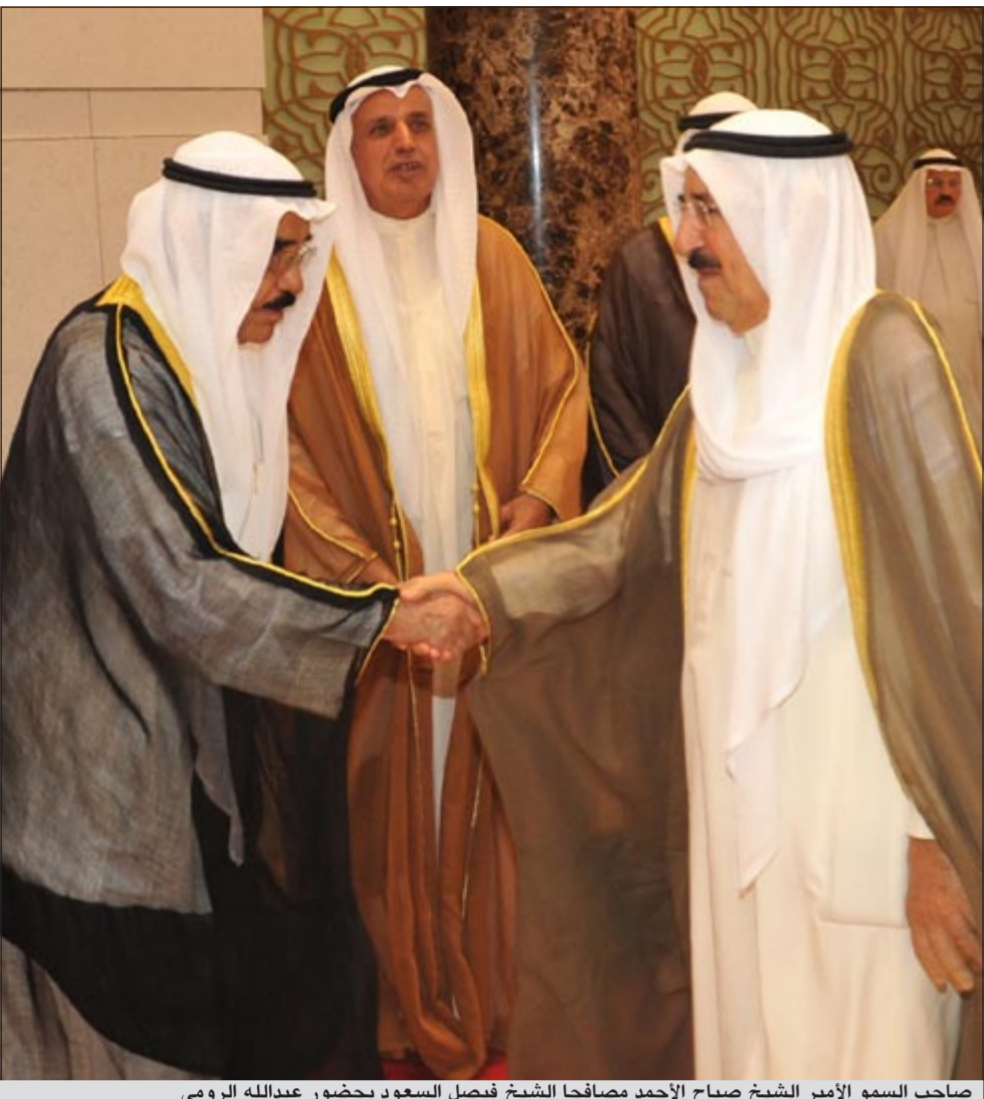
صاحب السمو الأمير الشيخ صباح الأحمد مضافاً الشيخ فيصل السعود بحضور عبدالله الرومي