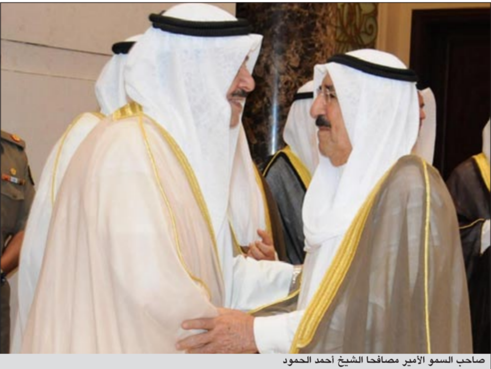
صاحب السمو الأمير مضافاً الشيخ أحمد الحمود

أديس أبابا - كونا: وصل صاحب السمو الأمير الشيخ صباح الأحمد والوفد الرسمي المرافق لسموه مساء أمس إلى مطار بولي الدولي بالجمهورية الديمقراطية الفيدرالية الإثيوبية والصدية وذلك لحضور مؤتمر القمة الأفريقية للاتحاد الأفريقي التاسع عشر. وقد كان في استقبال سموه على أرض المطار رئيس جمهورية بنين الصديقة ورئيس الاتحاد الأفريقي للدورة الحالية بوني يايي ورئيس مجلس الوزراء بالانابة ووزير الخارجية للجمهورية الديمقراطية الفيدرالية الإثيوبية الصديقة هيلي ماريام ورئيس مفوضية الاتحاد الأفريقي جان بينغ وسفيرنا لدى الجمهورية الديمقراطية الفيدرالية الإثيوبية الصديقة راشد فالح الهاجري وأعضاء السفارة. وعلى شرف صاحب السمو الأمير الشيخ صباح الأحمد والوفد الرسمي المرافق لسموه أقام سفيرنا لدى الجمهورية الديمقراطية الفيدرالية الإثيوبية الصديقة راشد فالح الهاجري مأدبة عشاء. وكان صاحب السمو الأمير الشيخ صباح الأحمد والوفد الرسمي