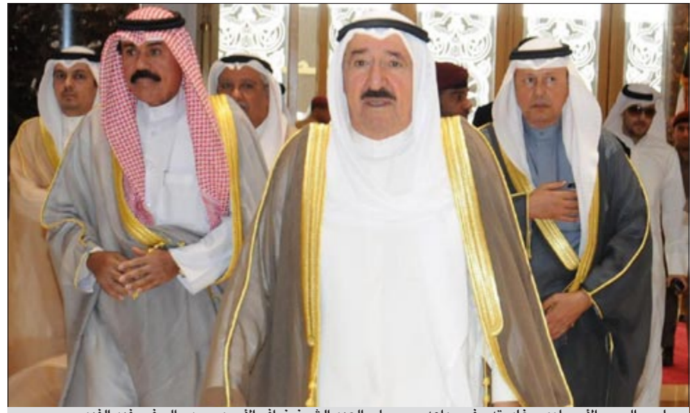
صاحب السمو الأمير لدى مغادرته وفي وداعه سمو ولي العهد الشيخ نواف الأحمد ويبدو السفير فيد الفهد

الدبوان الأميري الشيخ علي الجراح والوزراء وكبار المسؤولين بالدولة وكبار القادة بالجيش والشرطة والحرس الوطني. هذا ويرافق سموه وفد رسمي يضم كلا من نائب رئيس مجلس الوزراء ووزير الخارجية ووزير الدولة لشؤون مجلس الوزراء الشيخ صباح الخالد وأحمد الفهد مدير مكتب صاحب السمو الأمير والمستشار بالديوان الأميري د. يوسف الإبراهيم والمستشار بالديوان الأميري محمد أبو الحسن والمستشار بالديوان الأميري د. عادل الطبطبائي ووكيل وزارة الخارجية خالد الجارالله وعدد من كبار المسؤولين في الديوان الأميري ووزارة الخارجية. إلى ذلك، بعث صاحب السمو الأمير الشيخ صباح الأحمد ببرقية تهنئة إلى الرئيس فرنسيس هولاند رئيس الجمهورية الفرنسية عبر فيها سموه عن خالص تهنئته بمناسبة العيد الوطني لبلاده متمنياً له موفقاً في الصحة والعافية والبلد بالصدق دوام التقدم والأزدهار. وبعث سمو ولي العهد الشيخ نواف الأحمد وسمو رئيس مجلس الوزراء الشيخ جابر المبارك ببرقتي تهنئة مماثلتين.