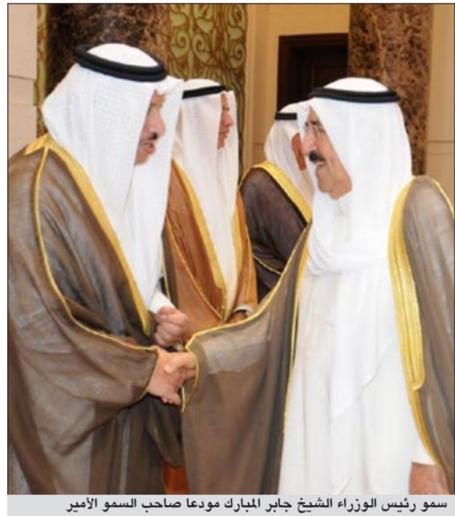
سمو رئيس الوزراء الشيخ جابر المبارك مودعا صاحب السمو الأمير