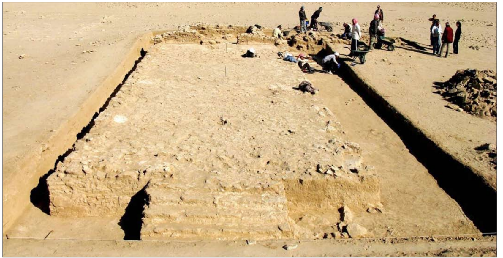
آثار لكنيسة قديمة في منطفة الشويخ