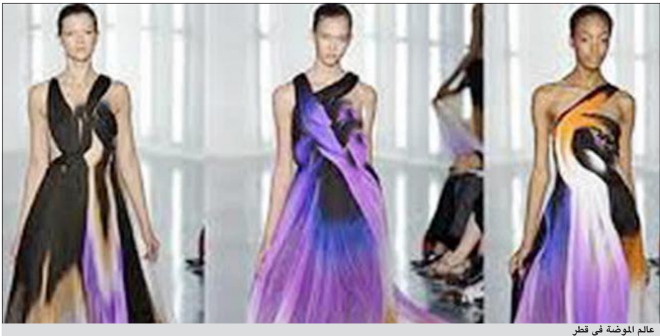
عالم الموضة في قطر

الدار هناك ايضا لوكا وغايتانو مارسوتو، لافتة الى ان علامة تجارية أخرى في عالم الأزياء الإيطالية تنتقل للخارج بعد بيع فيندي وجوتشي وبولجاري وفق