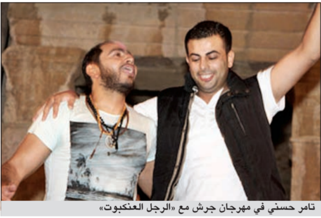
تامر حسني في مهرجان جرش مع «الرجل العنكبوت»

الحقيقي الذي بدا خاضعا لسلطة نجمة في الحفل من بدايته لنهايته. وافتتح تامر حفله الجماهيري الكبير بأغنيته «كل مرة أشوفك...»، تلاها بمجموعة كبيرة من أغانيه الشهيرة مثل «حاجات علمتها لك» و«قرب حبيبي» وغيرهما. وقيل دقائق من انتهاء حفله الجماهيري الحاشد وبعد نجاح أحد الشباب في التسلل إلى المسرح ومعاينته ثم نزوله سريعاً، فوجئ تامر حسني برؤيته شاباً معلقاً على تاج المسرح الجنوبي الأثري كـ «الرجل العنكبوت»، حيث تمسك يده اليسرى أحد الحجارة وقدمه على حجر صغير يريد الهبوط لكنه سقط قبل متابعة نزوله متسلقاً على الحجارة وسمع صوت مدو فظنن الناس أن رأسه تحطم أو جسده لأن الارتفاع ليس بسيطاً لكنه لم يصب بأذى وفاز بعناق نجمة المفضل الذي خاطر بحياته لأجله، فعانقه تامر وكافاه بالغباء والرقص معه على المسرح، ولم يعلم هل هذا الاستعراض حقيقي