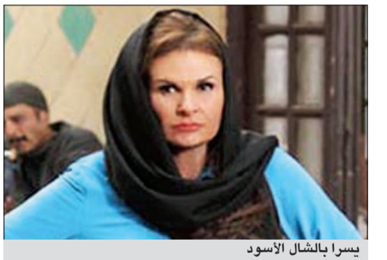
يسرا بالشال الأسود