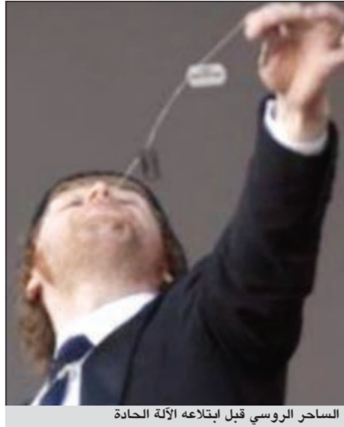
الساحر الروسي قبل ابتلاعه الآلة الحادة

وقالت سونوبي: إن الخاتم مصنوع من الذهب والمرصع بحجر فيروز بيضاوي آثار معركة بين ثمانية مزايدين واشترته في نهاية المطاف أحد الهواة المجهولين عبر الهاتف. وقال د.جابريل هيتون المتخصص في المخطوطات بسونوبي في بيان «خاتم جين