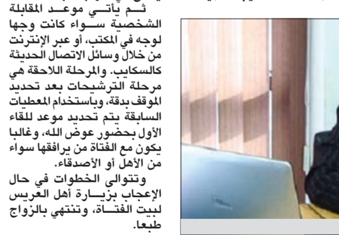
تعمت عوض الله

ومضت تقول ان «آثار كدمات كانت تغطي جثة (ناتالي وود) (وبحسب تقرير التشريح) من المستحيل ان تكون اصيبت بهذا الحكم من الكدمات من خلال