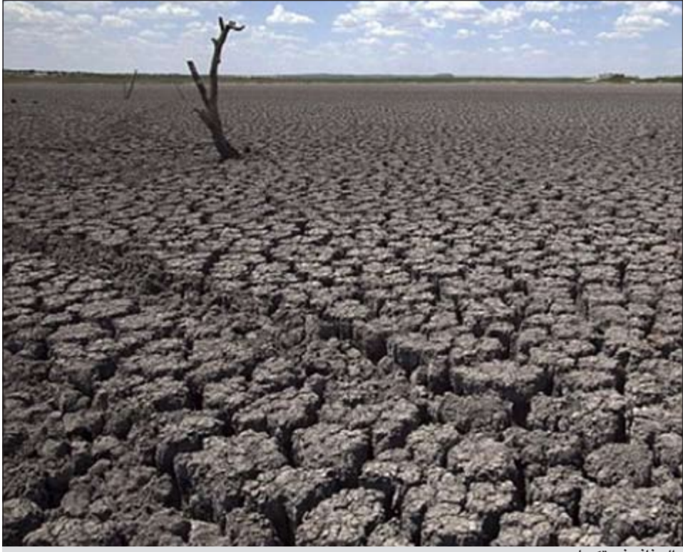
الجفاف في تكساس

السنوي للعلماء وللمواطنين تحليلاً لما حدث حتى نتكمن من الاستعداد لكل ما هو آت». وبخلاف قياس ما حدث في عام 2011 يهدف فريق العلماء إلى البدء في الإجابة على سؤال يطرحه مراقبون للطقس منذ سنوات: هل يمكن إثبات أن تغير المناخ مسؤول عن ظواهر جوية محددة؟ وأقر خبراء المناخ بأن علم إسناد الظواهر كما يطلقون عليه في مرحلته المبكرة.