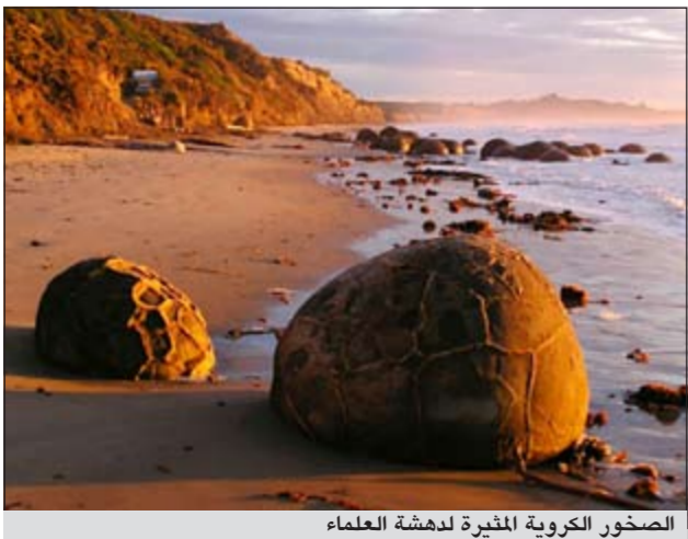
الصخور الكروية المثيرة لدهشة العلماء

وكالات: إحدى الألغاز التي حيرت علماء الجيولوجيا صخور المويراكي (Moeraki) وهي صخور دائرية الشكل مجهزة المنشأ فشكها الكروي الغريب وتجويفها الداخلي وقشرتها الخارجية المتصدعة وتواجدها في أماكن غير متوقعة جعلها سرا من أسرار الجيولوجيا. بعض الصخور تشكلت من الحجارة، والبعض الآخر من الحديد، وتتراوح أعمارها بين 5 و 50 مليون سنة، ومن المذهل أن هذه الصخور قد تشكلت أيضا على سطح المريخ ويقيد العلماء بأن ذلك حدث بسبب