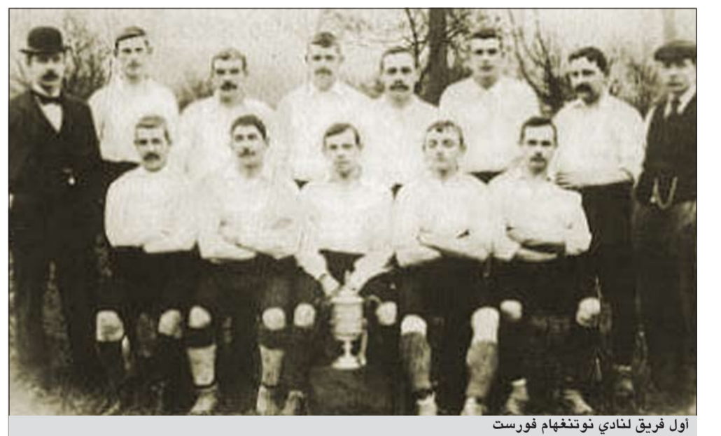
أول فريق لنادي نوتنغهام فورست