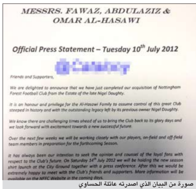
صورة من البيان الذي أصدرته عائلة الحساوي