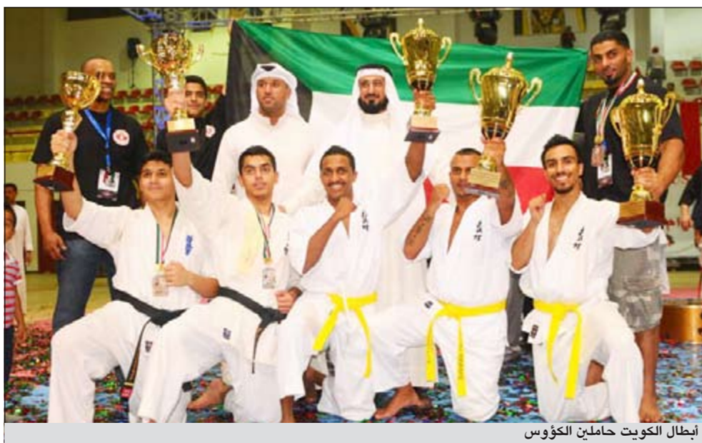
إنباط الكويت حاملين الكؤوس

رئيس اللجنة المنظمة للبطولة ومؤسسات وهيئات الدولة ووزارة الداخلية لما قدموه من اجل انجاح البطولة نظراً لاهميتها. وشارك في البطولة 20 دولة أبرزها: اليابان، طاجكستان، اوزبكستان، هنغاريا، هولندا، اليونان، بريطانيا، السعودية، الأردن، ولبنان.