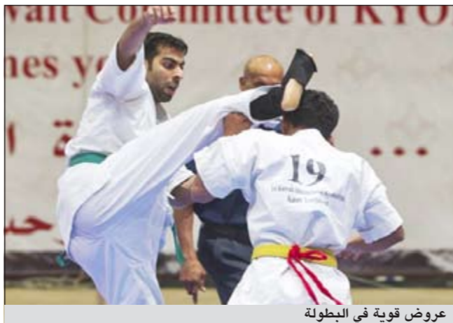
عروض قوية في البطولة

رئيس اللجنة المنظمة للبطولة ومؤسسات وهيئات الدولة ووزارة الداخلية لما قدموه من اجل انجاح البطولة نظراً لاهميتها. وشارك في البطولة 20 دولة أبرزها: اليابان، طاجكستان، اوزبكستان، هنغاريا، هولندا، اليونان، بريطانيا، السعودية، الأردن، ولبنان.