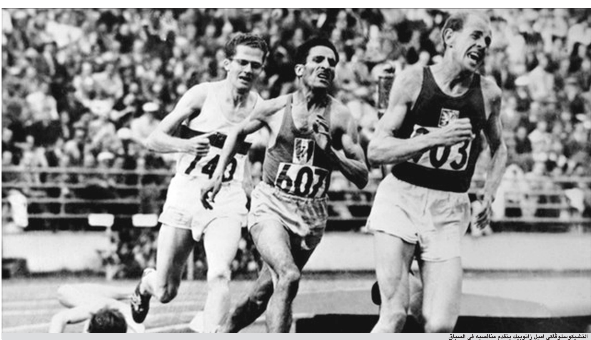
التشيكوسلوفاكي اميل زاتوبيك يتقدم منافسيه في السباق

اندلعت حرب كوريا في 25 يونيو 1950 فهبت رياح الحرب الباردة بين الكتلتين الشرقية والغربية، معلنة نزاعا سيمتد عقودا ويغير أوجها كثيرة منها الرياضة.