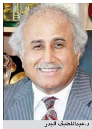
د. عبداللطيف البدر

حصلت «الأنباء» على مقترح تجمع حملة شهادة الدكتوراه الكويتيين لحل أزمة القبول الجامعي والذي تقدمت به الى مدير جامعة الكويت د. عبداللطيف البدر، والذي يتضمن إنشاء فروع لجامعة الكويت. وجاء في المقترح انه منذ 4 سنوات وأزمة القبول الجامعي أخذت في الاتساع دون اتخاذ خطوات لحلها سواء من مجلس الجامعة أو وزارة التعليم العالي رغم تحذيرنا في التجمع بوقوع أزمة القبول الى ان أتى الصيف الماضي واعترف مجلس الجامعة بوقوع أزمة القبول الجامعي بعد تعقد الأزمة وتشعبها. لذا أتقدم بهذا الاقتراح لسعادتكم مساهمة في حل الأزمة والحل هو إنشاء فروع لجامعة الكويت وهذا