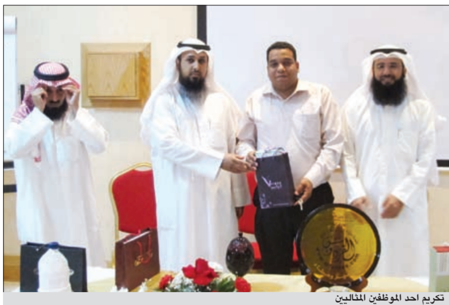
تكريم احد الموظفين المتأهلين

المجتمع وشعروا بالرضا والسعادة. وأوضح المطيري أن برنامج الحفل قد اشتمل على الآتي: تكريم الموظف / العامل المثالي لعام 2011، تكريم القسم المثالي للنصف الأول من عام 2012، تكريم الفائزين في المسابقات الخاصة بالحفل، عرض فيلم تسجيلي عن الرحلة التي أقامتها اللجنة للموظفين. مشيرا إلى أن إدارة اللجنة قامت بتوزيع هدايا عينية وشهادات تقدير لجميع الموظفين والعاملين من أجل تحفيزهم وتشجيعهم على العطاء والتميز دائما.