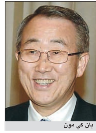
بان كي مون

بتعهداتها وتعاونها المستمر مع لجنة التعويضات». وأضاف أن «المبلغ الإجمالي للتعويضات الذي دفعته اللجنة إلى الآن يقرب من 36,4 مليار دولار ويتبقى ما مجموعه 16 مليار دولار يتعين دفعها، وتشير التقديرات إلى أنه سيتم دفع هذا المبلغ بالكامل بحلول مطلع عام 2015». وأشار إلى أنه منذ بداية العام الحالي قدمت اللجنة العراقية تعويضات للكويت على دفعتين بلغت كل واحدة منها مليار دولار، حيث قدمت الدفعة الأولى في 26 يناير والثانية في 26 ابريل ومن