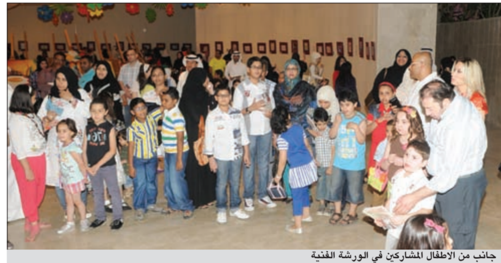
جانب من الأطفال المشاركين في الورشة الفنية