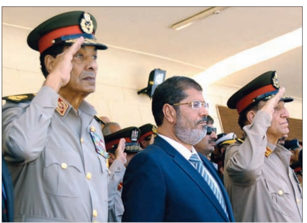
الرئيس المصري د.محمد مرسي يتوسط المشير محمد حسين طنطاوي ورئيس الأركان سامي عنان خلال حفل عسكري أمس الأول

الصادر أمس الأول قد حال دون استكمال المجلس مهامه فسندرت ذلك لأننا دولة قانون تحكمتها سيادة القانون واحترام