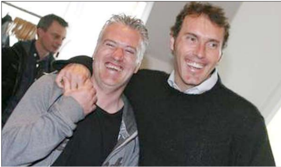
ديشان مع المدرب السابق للديوك لوران بلان

وختم قائلاً: «سأقوم بخياري وستكون لنا فرصة للحديث بهذا الأمر في الأسبوع الذي يسبق المباراة الودية ضد الأوروغواي» في 15 أغسطس في مدينة لوهافر. من جانبه، أوضح رئيس الاتحاد نويل لوغرايه خلال تقديم ديشان «سسيكون مدنيا لمدة سنتين مع اثنتين إضافيتين إذا تاملنا إلى نهائيات كأس العالم» في البرازيل عام 2014.