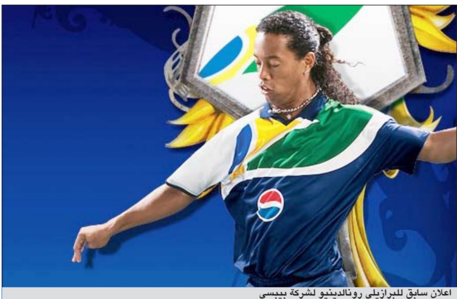
إعلان سابق للبرازيلي رونالد ديفيو لشركة بيبسي

عقد بمناسبة تقديمه رسمياً كلاعب لفريق أتلتيكو مينيرو الذي تعاقده معه بعد رحيله المثير للجدل عن صفوف فلامنغو، وأكد بونتيس أن تشوه صورة رونالد ديفيو كان سببا قويا وراء فسخ العقد، فبعد عودة رونالد ديفيو إلى البرازيل أوائل عام 2011 عقب رحيله عن برشلونة الإسباني وانضمامه إلى فلامنغو، قدم اللاعب عرضا جيدة في بداية مشواره مع فلامنغو لكنه بدأ بتصرف بطرق مثيرة للجدل خارج الملعب وهو ما سيطر على عناوين الصحف لفترة.