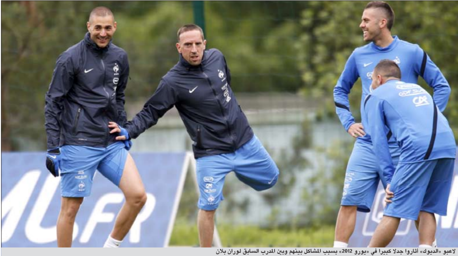
لاعبو «الديوك» أثاروا جدلا كبيرا في «يورو 2012» بسبب المشاكل بينهم وبين المدرب السابق لوران بلان

● يحتضن مضمار تايبيه العريق في السويد الجولة السابعة من أعلى بطولته للخيول العربية في العالم للسيدات، وتتنافس فيه فارسات من تسع دول.