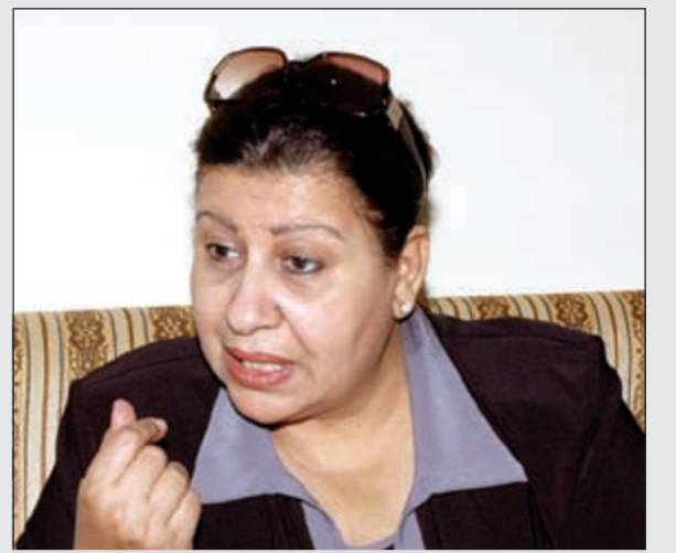
الإعلامية القديرة أمل عبدالله