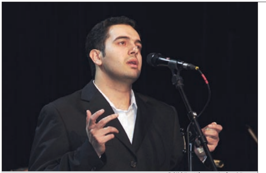
سيد النور في إحدى حفلاته الغنائية