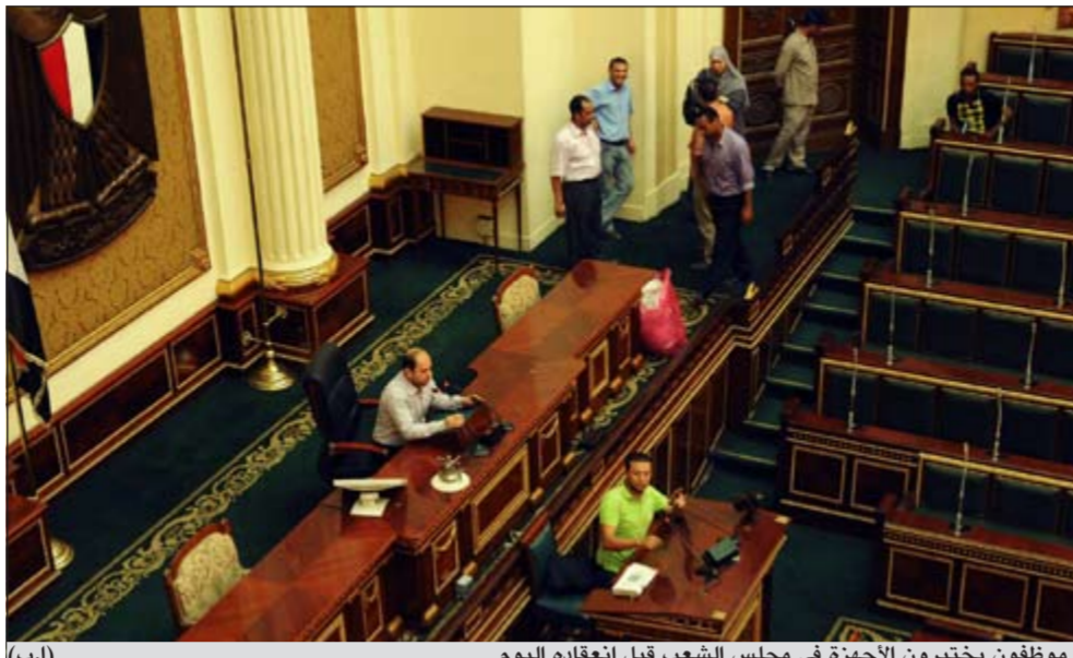
موظفون يختبرون الأجهزة في مجلس الشعب قبل انعقاده اليوم