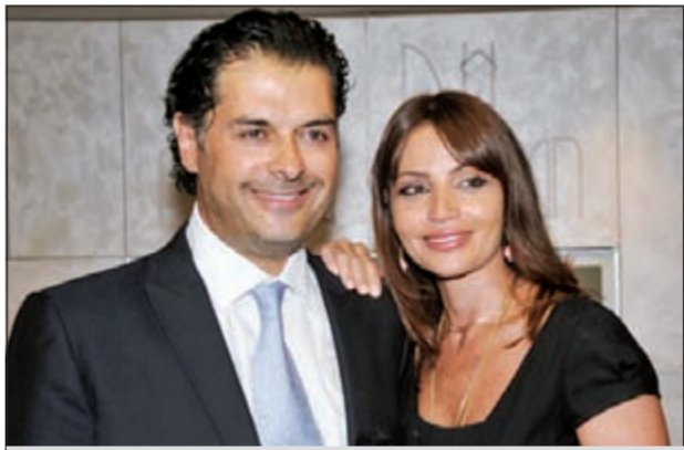
راغب علامة مع زوجته جيهان

سارع الفنان راغب علامة الى مطالبة احد المواقع الالكترونية بالاعتذار عما نشره من تصريح مفبرك على لسانه، ينتهجم فيه على زملائه، وخصوصاً الفنانة نجوى كرم.