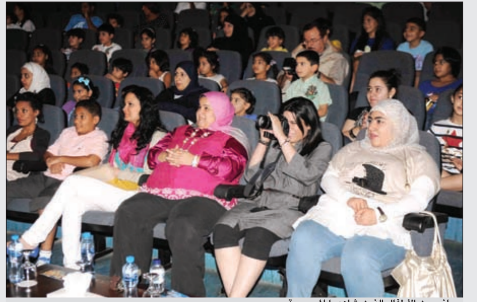
جانب من الأطفال الذين شاهدوا المسرحية