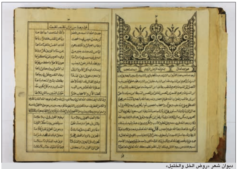
ديوان شعر «روض الخل والخليل»