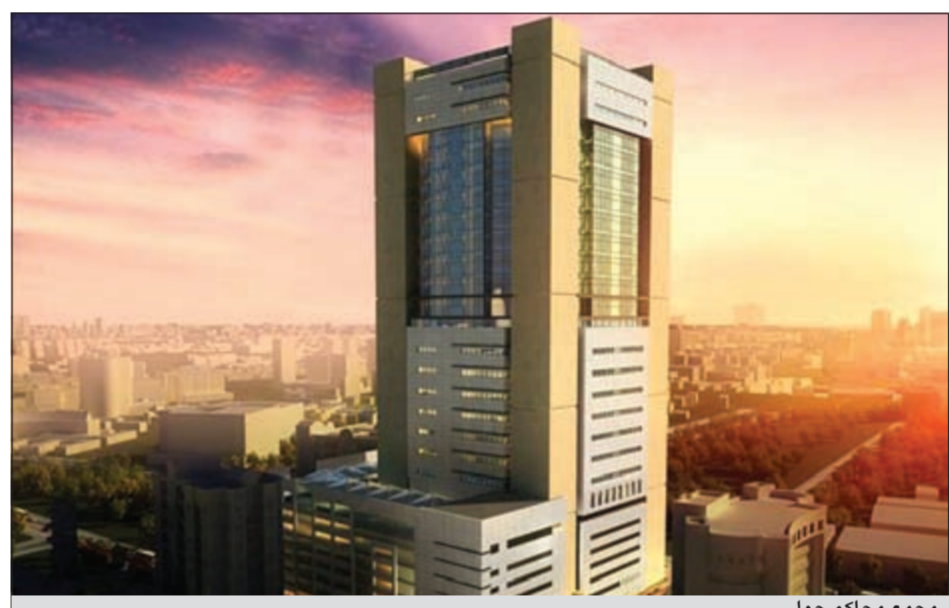
مجمع محاكم حولي

وبيّن أن الخدمات تعمل على إعادة تأهيل محطة ضخ مشرف وتنقية محطة الرقة والجهراء وأم الهيمان، إضافة إلى الخدمات العامة لتشغيل وصيانة مركز التحكم ومحطات الري الزراعي وتشغيل وصيانة محطات الضخ والتنقية التابعة لمدينة لآسي الخيران والوفرة ومضخات وخطوط وشبكة توزيع المياه المعالجة لمزارع العبدلي والخدمات العامة لحماية البيئة من ملوثات الصرف الصحي.