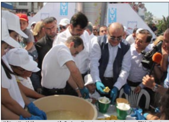
وزير الطاقة جبران باسيل ووزير السياحة فادي عبود أثناء الاحتفال