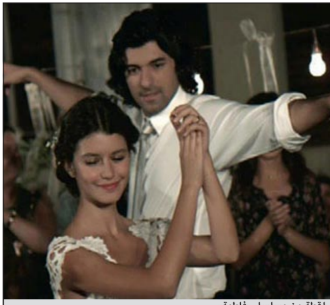
لقطة من مسلسل «فاطمة»

وكالات: استطاع مسلسل فاطمة التركي ان يحقق ارقام مشاهدة عالية وغير مسبوقة لاي مسلسل عربي او مبدلج على الاطلاق، وذلك بعدما استطاع المسلسل الذي يحكي قصة شابة تركية تتعرض للاغتصاب المتكرر من عدد من المقربين لها ان يتعدى حاجز المائة مليون مشاهد عربي. وحسب جريدة «نورت» افادت المؤسسة العربية للاعلام الموجودة في بيروت وفقا لمصادر اعلامية ان حلقات المسلسل تشاهد من أكثر من مائة مليون متفرج عربي وهو رقم غير مسبوقة ولم يتحقق الا لبعض القنوات الاخبارية كالجزيرة اثناء تغطيتها لاحداث 11 سبتمبر وحرب أميركا على العراق. واكدت المؤسسة في التقرير الذي نشر مطلع هذا الاسبوع ان المسلسلات العربية والمبدلجة لم يسبق ان وصلت الى هذا الحد من المتتبعين، كما اشارت الى ان الرقم قد يكون اكبر بكثير خصوصا ان قاعدة بيانات محرك البحث الأشهر غوغل قد اكدت ان «مسلسل فاطمة» هي الجملة الأكثر بحثا على الصعيد العربي. الجدير بالذكر ان مسلسل فاطمة هو مسلسل تركي يتم عرضه على العديد من الشاشات ومبدلجة سورية جيدة للغاية، وقد استطاع المسلسل بحبكة الدرامية المميزة وشخصياته الواقعية ان يجذب المشاهد العربي لتابعته خصوصا في مصر ودول الخليج، كما ان بحثا بسيطا على الانترنت سيظهر ان حلقاته هي الأكثر مشاهدة على مواقع اليوتيوب وغيرها من مواقع تحميل الحلقات التلفزيونية.