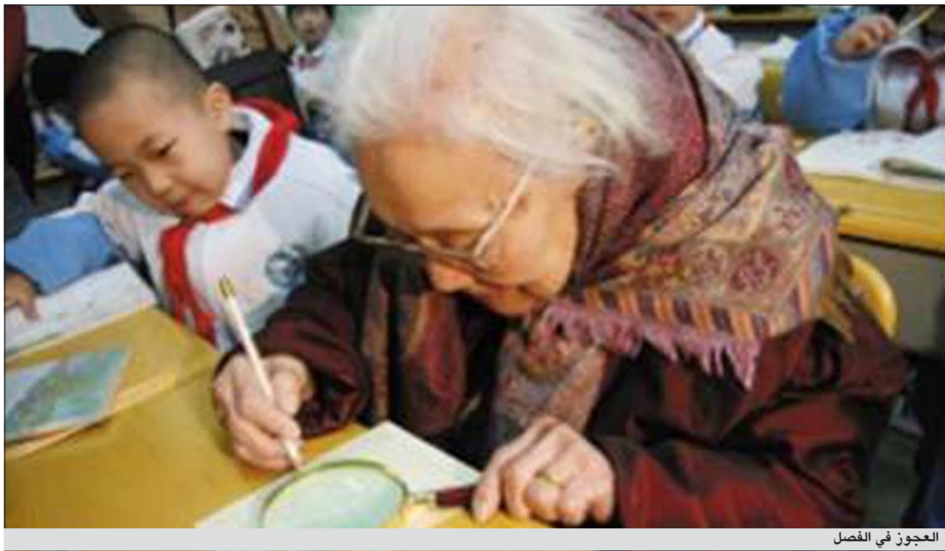
العجوز في الفصل

مانيلاب. أ.ش.أ. أخيراً تحقق حلم قصار القامة في الانخراط بصفوف الجيش الفلبيني والارتقاء لأعلى الرتب، وذلك بعد أن قررت أكبر الأكاديميات العسكرية في الفلبين تعديل الشروط المتعلقة بالطول. وذكرت قناة «فرانس 24» الاخبارية الفرنسية الليلة ان الميجور جنرال نونانو براتيليا قائد الأكاديمية العسكرية الفلبينية وافق على انضمام قصار القامة من الذكور والنساء الذين يبلغ طولهم خمسة أقدام أو ما يعادل 1,52 متراً على الأقل إلى صفوف الدراسة في الأكاديمية. يشار إلى أن شروط الانضمام إلى الأكاديمية في الماضي كانت تنص على ضرورة الا يقل طول الذكور عن خمسة أقدام وأربع بوصات، والإناث عن خمسة أقدام وبوصتين، الأمر الذي كان يدفع المتقدمين ذكورا وإناثا إلى الحصول على وساطة أحد أعضاء الكونغرس للاعفاء من شرط الطول.