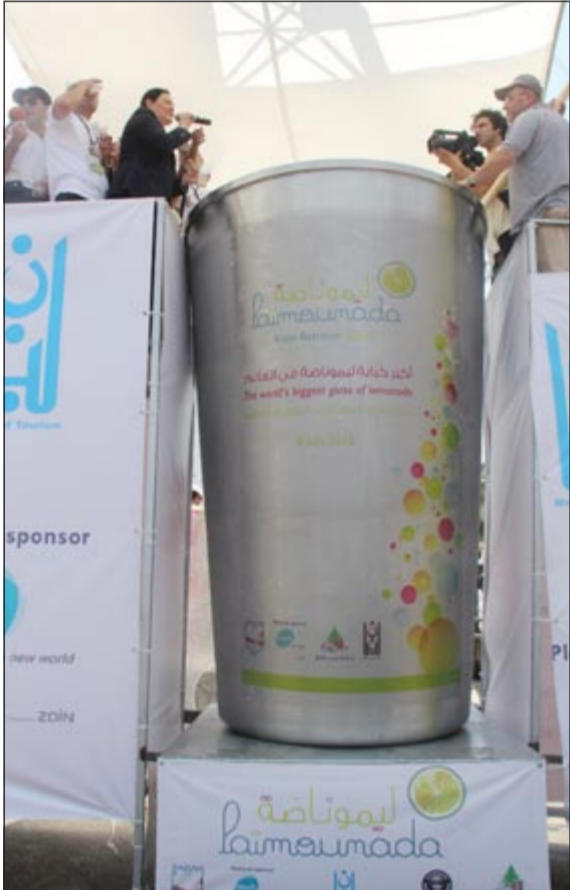
كوب الليموناضة اللبناني (محمود الطويل)

بيروت - أ.ش.أ. دخلت مدينة البترون بشمال لبنان موسوعة غينيس للأرقام القياسية لتحضيرها أكبر كوب عصير من الليموناضة بسعة 5 آلاف و543 ليترًا والتي اشتهرت بها البترون منذ القدم. وشارك في تحضير الكوب 400 شاب وشابة من مختلف قرى وبلدات القضاء استخدموا 2200 كيلو ليمون ومنجوا عصيرها مع ألف كيلو سكر و3 آلاف ليتر مياه وألف كيلو من مكعبات الثلج ملء كوب قاعدته 140 سنتيمترا وارتفاعه 285 سنتيمترا واتساع فمحه 185 سنتيمترا. وبعد كسر الرقم القياسي وإعلان نتيجة الفوز ودخول موسوعة غينيس وزعت الليموناضة مجانًا في المطاعم وفي الشواطئ وفي الأماكن العامة كما أقيمت حواجز لليموناضة على الطرقات العامة لتقديم العصير.