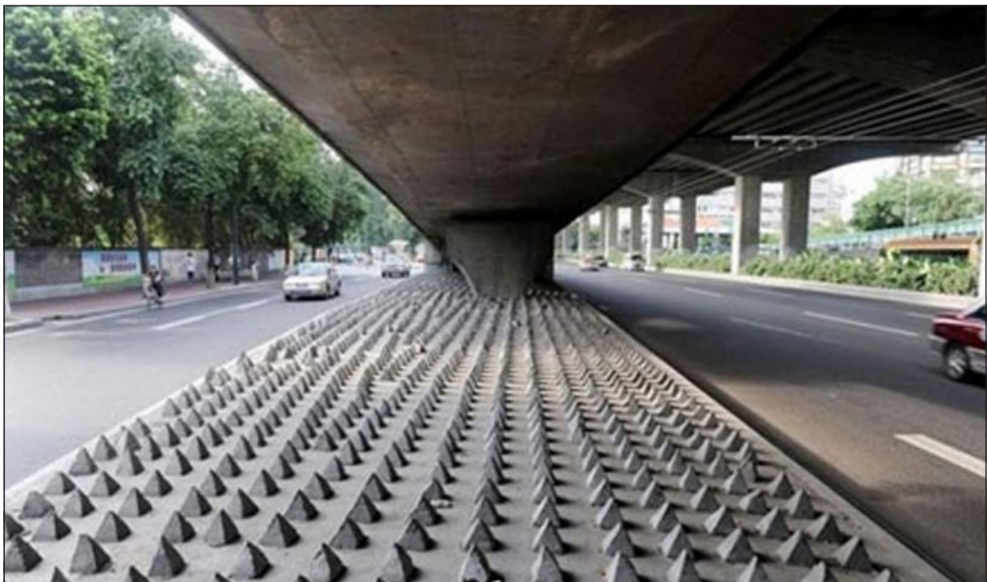
أهرامات تحت جسر في الصين

هذه المجسمات الصغيرة والحادة تستخدم لمنع المشردين من النوم أسفل الجسور لأنه مكان النوم المفضل لهم رغم خطورته عليهم.