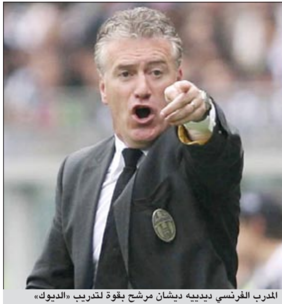
المرب الفرنسي بدييه ديشان مرشح بقوة لتدريب «الديوك»

يجري قائد منتخب فرنسا السابق لكرة القدم بدييه ديشان مفاوضات مع الاتحاد الفرنسي لشغل منصب المدرب الشاغر بعد استقالة زميله السابق لوران بلان على خلفية النتائج في كأس أوروبا الأخيرة في بولندا وأوكرانيا، ونقل مصدر مقرب من ديشان «إننا في خضم المفاوضات، إنها خطوة إضافية لكن لن نصل بعد إلى نتيجة، وإذا ما أدى ذلك إلى اتفاق فلا أظن أنه سيكون غداً»، ويأتي فتح باب المفاوضات بعد أسبوع من قرار بلان الذي أشرف على المنتخب منذ يوليو 2010، تمديد عقده بسبب عدم الاتفاق مع رئيس الاتحاد نويل لوغرايهيه. وكان لوغرايهيه المرحب بالقاء في مؤتمر صحفي إلى ان ديشان بالنسبة الهه هو الأوفر حظاً لتولي منصب المدرب، وذلك بعد 24 ساعة من فسح الأخير عقده مع نادي مرسيليا.