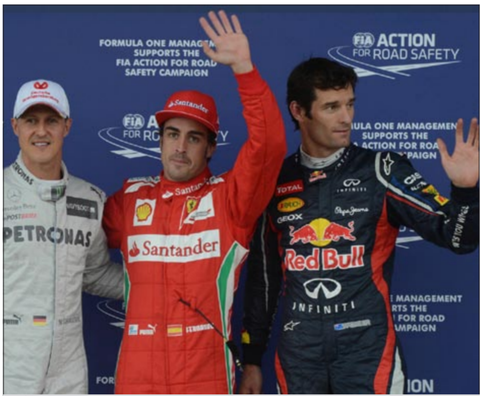
مارك ويبر يفوز بسباق بريطانيا للفورمولا واحد ويتفوق على النوسو وشوماخر

أحرز الاسترالي مارك ويبر (ريد بول-رينسو) المركز الأول في سباق جائزة بريطانيا الكبرى، المرحلة التاسعة من بطولة العالم للفورمولا واحد، أمس على حلبة سيلفرستون، وحل ويبر أمام الإسباني فرناندو ألونسو (فيراري) وزميله في فريق ريد بول الألماني سيباستيان فيتل بطل العالم في الموسمين الماضيين.