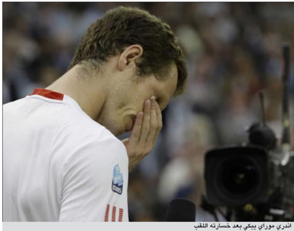
اندري موراي يبكي بعد خسارته للقب

في المباراة بل فقد إرساله 3 مرات بمعدل واحدة في كل من المجموعات الثلاث الأخيرة وخسر الرهان وفوت الفرصة في رابع نهائي يخوضه في البطولات الكبرى والثالث أمام فيدرر.