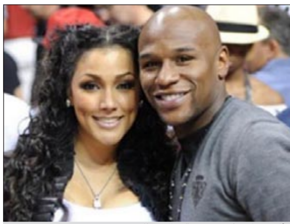
فلويد مايويذر مع صديقته الحسنة

ربما يكون بمقدور بطل العالم للملاكمة بالوزن الوسط الأميركي فلويد مايويذر أن يطيح بجميع خصومه على أرض الحلبة، غير أن تعقيب عقله خارج الحلبة أطاح به في غياب السجن. ويستطيع مايويذر الاستمتاع بترعيه على عرش أغنى رياضي في العالم عن الموسم الماضي، كما أنه يعيش أجمل لحظات الحب مع عارضة الأزياء الأكثر إثارة في شمال أميركا والعالم شانتييل جاكسون. غير أن هذا الاستمتاع توقف عند حد فاصل، بعدما نطق قاضي محكمة لاس فيغاس بالحكم، وعاش بطل العالم بوزن الوسط تحت وطأة التهديد بالسجن 6 أشهر والذي حكم به منذ العام الماضي، مع وقف التنفيذ لأكثر من مرة بناء على الطعون التي تقدم بها محامي الملاكم الشهير، والذي اقتنع أخيراً بالوقوف خلف القضايا لمدة تناهز التسعين يوماً بتهمة استخدام العنف ضد صديقته السابقة جوسي هاريس.