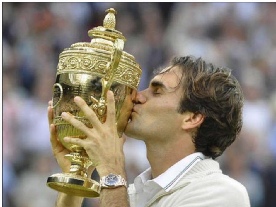
السويسري روجيه فيدرر يقبل كأس البطولة