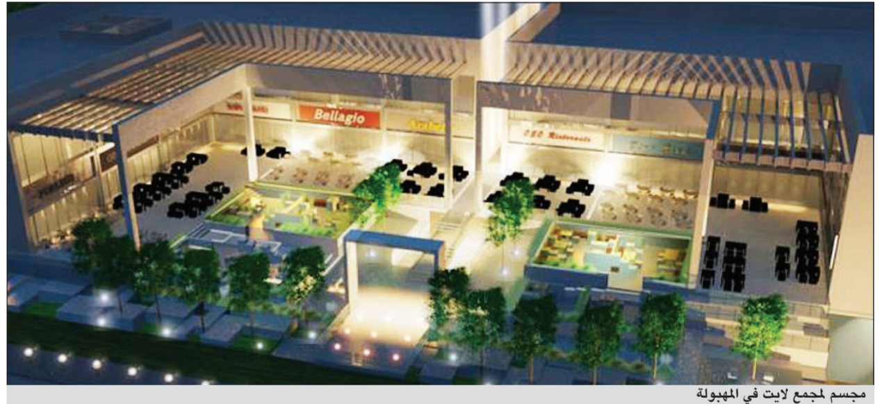
مجمع لاييت في المبهولة

ويقع «لايت light» على أهم المقاطعات بالطريق الساحلي بمنطقة المبهولة، صمم ليضم نخبة من أرقى المطاعم المحلية والعالمية على مساحة أرض 2م5,970 وبمسطح بناء للطابق