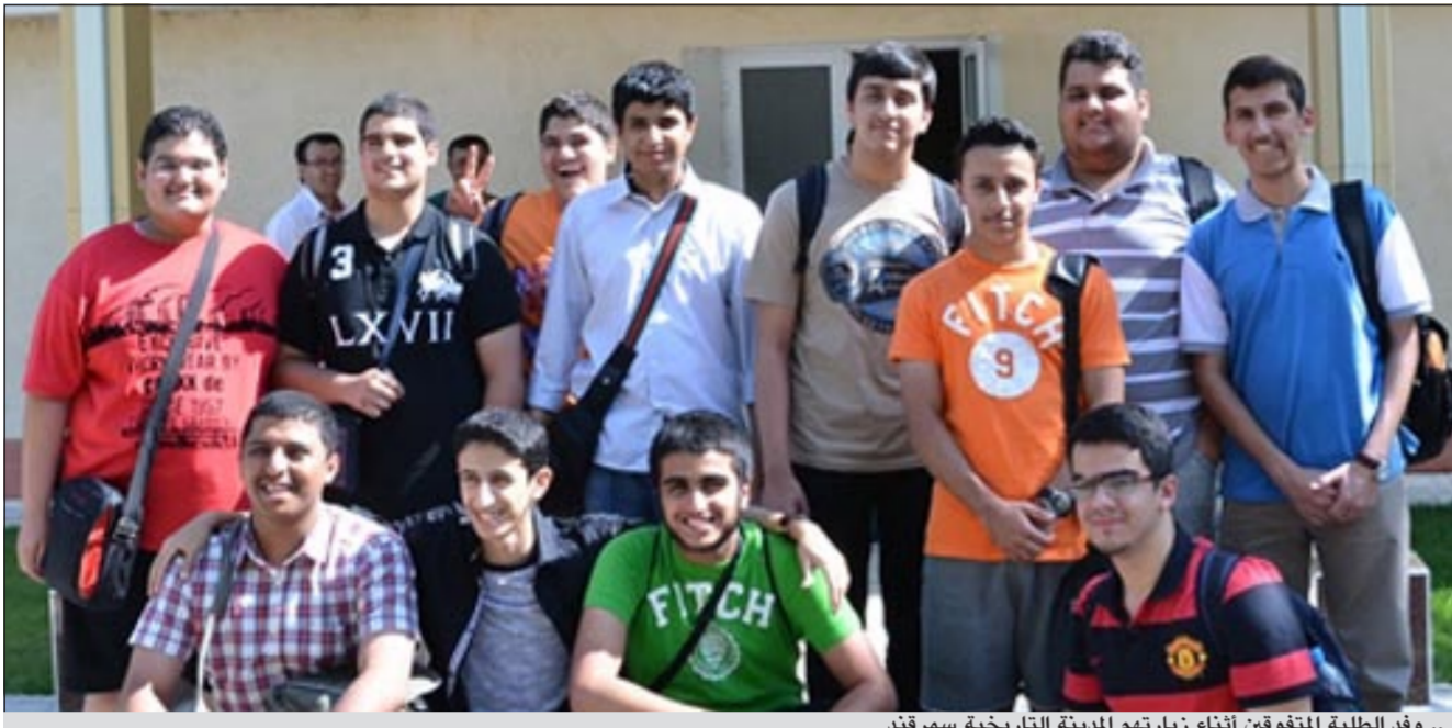
.. وقد الطلبة المتفوقين أثناء زيارتهم المدينة التاريخية سمرقند