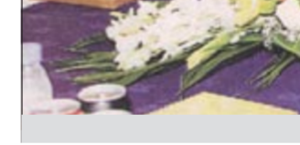
جانب من المشاركين في الملتقى