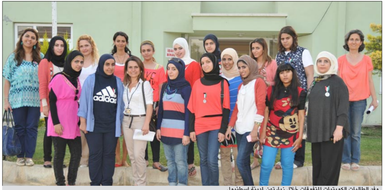
وفد الطالبات الكويتيات المتفوقات خلال زيارتهن مدينة إسطنبول