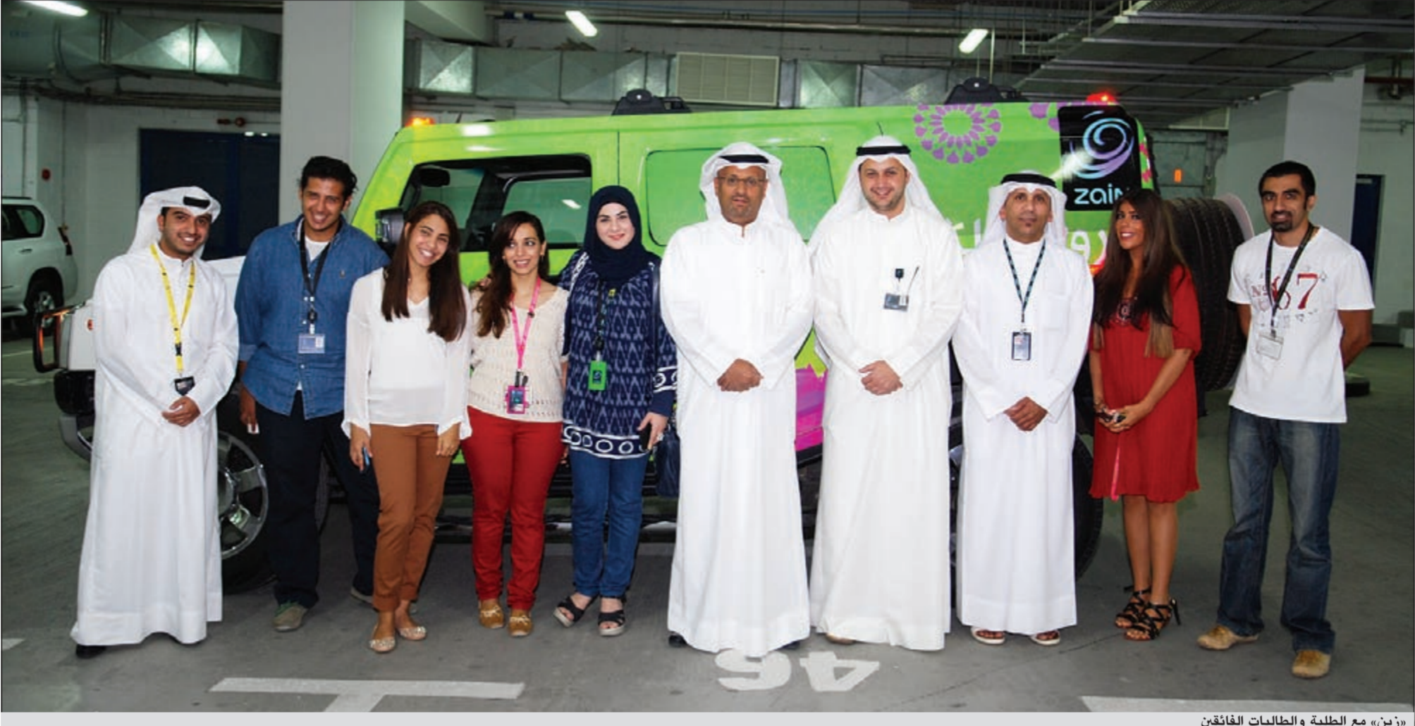
«زين» مع الطلبة والطالبات الفائزين

وتحد جديد، وأضاف بقوله: شركة زين تدرك تماماً أن تنمية المجتمع أمر بالغ الأهمية بالنسبة إلى نجاحها العام، وتدرك أيضاً أن التعليم هو البوابة الرئيسية لتنمية هذه المجتمعات، وفي ظل ذلك فهي أخذت مجموعة من المبادرات في هذا الاتجاه نظراً للدور الحيوي الذي يلعبه التعليم في النسيج الاجتماعي للأمم والشعوب. وبين العمر أن شركة زين أخذت تتحرك من منطلق الإيمان بالقضايا، فهي تؤمن بأن المسؤولية الاجتماعية تشكل عنصراً تجارياً مؤثراً، مشيراً إلى أن «زين» ومن هذا المنطلق فهي تجسد روح المسؤولية الاجتماعية بما يضمن النجاح والرخاء للجميع. وعن أبرز المساهمات التي قامت بها شركة زين في هذا مجال التعليم، قال: لقد جسدت شبكة جامعة المستقبل التي أسستها الشركة مؤخرًا للشباب الكويتي هذه المعاني، فشبكة جامعة المستقبل هي كيان تنموي شبابي يتألف من طلاب جامعيين، يستثمرون أنفسهم تحت أجنحة «زين».