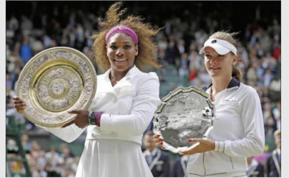
سيرينا وليامز تحمل درع بطولة ويمبلدون بجوار ابنة أختها انيسكا رادانيسكا صاحبة المركز الثاني

أحرزت الأميركية سيرينا وليامز المصنفة السادسة لقب فردي السيدات في بطولة ويمبلدون الإنجليزية، ثالثة البطولات الأربع الكبرى للتنس، بفوزها على البولندية انيسكا رادانيسكا الثالثة 6 و5 و2 في المباراة النهائية أمس، واللقب هو الخامس لسيرينا في ويمبلدون والرابع عشر في البطولات الكبرى. وكانت الأمطار قد أوقفت المباراة والنتيجة تشير إلى فوز سيرينا بالمجموعة الأولى 6، 1، 6، وتألق اللاعب الأميركية في المجموعة الأولى وحسمتها بسهولة لكن المجموعة الثانية شهدت ندية وتمكنت لاعبة البولندية من الفوز بها لتعادل النتيجة. ونجحت سيرينا في الفوز بأخر خمسة أشواط