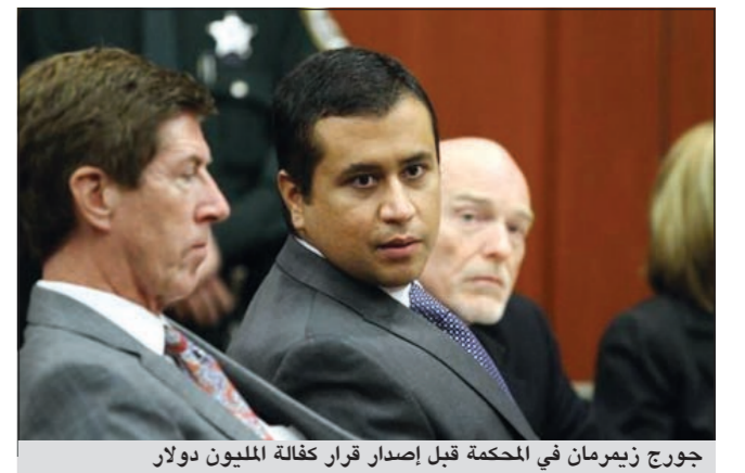
جورج زيمرمان في المحكمة قبل إصدار قرار كفالة المليون دولار

واشنطن - د.ب. أ: أفرجت السلطات الأميركية الجمعة عن رجل اتهم فني فبراير الماضي