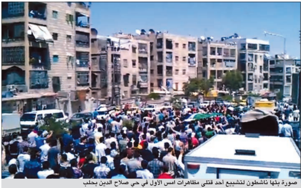
صورة بثها ناشطون لتشييع أحد قتلى مظاهرات امس الأول في حي صلاح الدين بحلب

وأضاف ان القوات النظامية «تحاول السيطرة على هذه المنطقة» التي تواجهت فيها أخيرا في معارك ضارية مع المجموعات المقاتلة المعارضة. وأدى القصف أمس الى مقتل