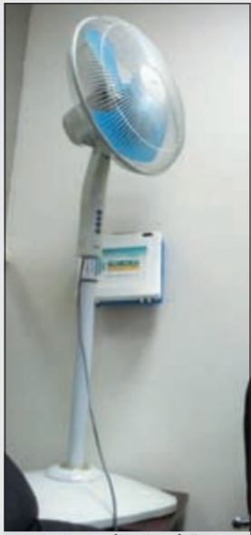
مروحة في ظل الأجواء الحارة