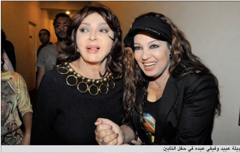
نبيلة عبيد وفيفي عبيد في حفل التأبين

ولفت الفنانتان، بحسب موقع «السينما دوت كوم»، نظر الجميع، خاصة أن جوا من المرح والمودة ظهر بشكل واضح بينهما، وقد التقطت عدسات المصورين عددا