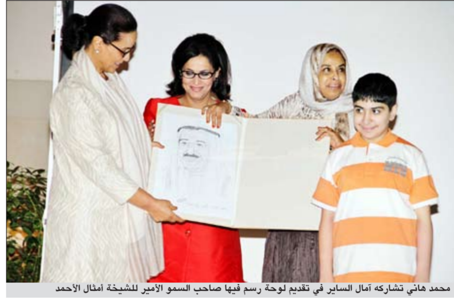
محمد هاني تشاركه أمثال السائر في تقديم لوحة رسم فيها صاحب السمو الأمير للشبيخة أمثال الأحمد

أكدت رئيس مجلس إدارة الجمعية الكويتية لاختلافات التعلم (كالد) أمثال السائر أن «العبء والتسامح وحب الوطن هو أساس تطور الحضارات والدول بعكس الجشع والأنانية والنقد الهدام الذي يدمر الشعوب ويقضي على الإنسانية ولهذا فنحن في أمس الحاجة لخطة وطنية واضحة المعالم تبدأ من أعلى موقع في السلطة التنفيذية تحدد اختصاصات ومهام كل مؤسسات الدولة المعنية بتعليم الاحتياجات الخاصة».