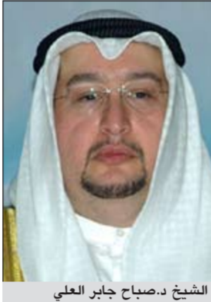
الشيخ د.صباح جابر العلي

عبر مدير عام مؤسسة الموائئ الكويتية الشيخ د.صباح جابر العلي نيابة عن أعضاء مجلس إدارة المؤسسة والعاملين بها عن صادق التهنية بتجديد ثقة سمو أمير البلاد المقدي في سمو رئيس مجلس الوزراء الشيخ جابر المبارك، سائلاً له التوفيق والسداد في النهوض بهذه المهمة الكبيرة، ومواصلة تفانيه المجهود ومساعده الدؤوب نحو إنجاز مسيرة الإصلاح وتحقيق نهضة تنموية شاملة تعود بالخير والرفاه والتقدم والازدهار على كويتنا الغالية وأهلها والأوفياء، متمنياً له كل التوفيق والسداد لتحمل اعباء هذه المسؤولية الوطنية وتحقيق طموحات وتطلعات الشعب، راجياً له موفور الصحة والعافية.