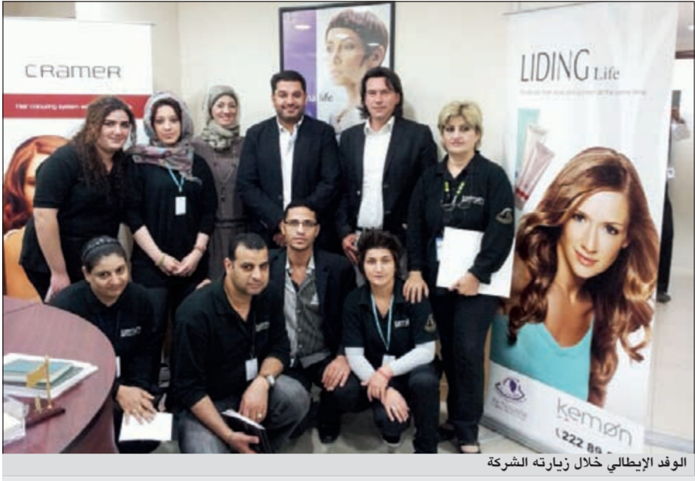
الوفد الإيطالي خلال زيارته الشركة