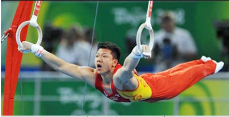
الصين حققت ميداليات عديدة في الجمباز والسباحة وألعاب القوى بأولمبياد «بيكين 2008»

تسعى الصين، التي فاجت العالم عندما انتزعت صدارة ترتيب الميداليات في أولمبياد بيكين 2008، إلى تكرار ذلك مرة أخرى في أولمبياد لندن من 27 يوليو الجاري حتى 12 أغسطس المقبل. الأداء القوي للعداء ليو جيانغ، الذي عادل مؤخرًا الرقم العالمي لسباق 110 أمتار حواجز، والسباح صن يانغ يشير إلى أن الصين ستحتل أن إنجاز «بيكين 2008»، لم يكن مرة واحدة فقط.