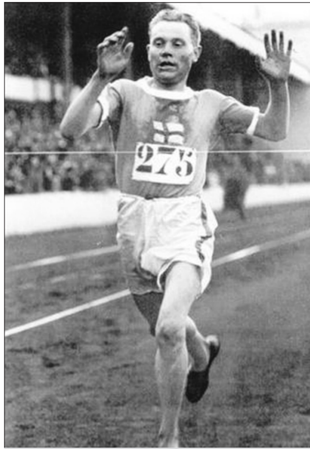
العداء الفنلندي بافو نورمي أبرز أبطال أولمبياد باريس 1924

ويقول ليو «حلمي هو فقط الانتظام في المنافسات الأولمبية وأمل أن أحافظ على مستواي الجيد وأن أوصل برنامجي التدريبي كاملاً». كما يبدو أن صن يانغ سيكون من أصحاب الميداليات في منافسات السباحة بعد أن طمس رقم البطل الأولمبي الاسترالي غرانت هاكيت الصامد من 10 أعوام في سباق 1500م في بطولة العالم الأخيرة في شنغهاي الصينية العام الماضي. لكن القصة الحقيقية للنجاح الصيني في الحصاد الوفير للميداليات في أولمبياد بيكين 2008 كانت في بعض الرياضات التي تعتبر اختصاصاً لرياضيينها ككرة الطاولة والبادمinton والغطس والرمية ورفع الأثقال وأيضاً الجمباز، والتي كان