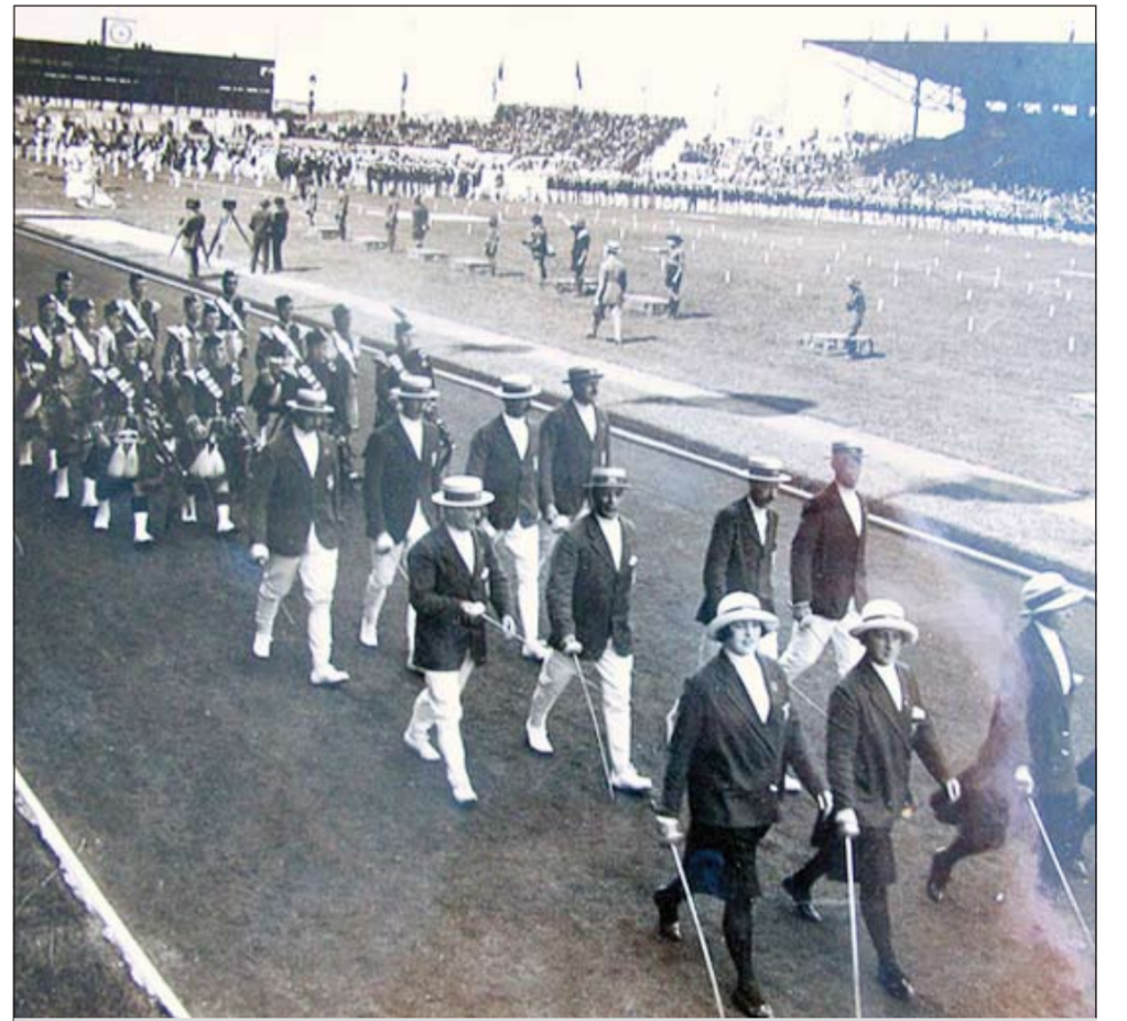
الرياضيون المشاركون في أولمبياد باريس 1924 في طليور العرض بحفل الافتتاح

وعرف عنه قيامه بتدريبات مرحلية تصاعديّة لضمان اللياقة والقدرة على التحمل، لذا سمي بـ «رجل الحسابات» والإيقاع والخطوات المدروسة الواسعة وانتظام ذلك مع التنفس وتألفه، علماً أن بلوغ ذلك بحاجة إلى فارق، وقاد الفرقة الموسيقية شارل مونش. بلغ طول لفة مضمار ستاد كولومب 500م، وتنافس في «السباق الأسطوري» 3 أميركيين و4 بريطانيين، ومارتن الذي أصبح