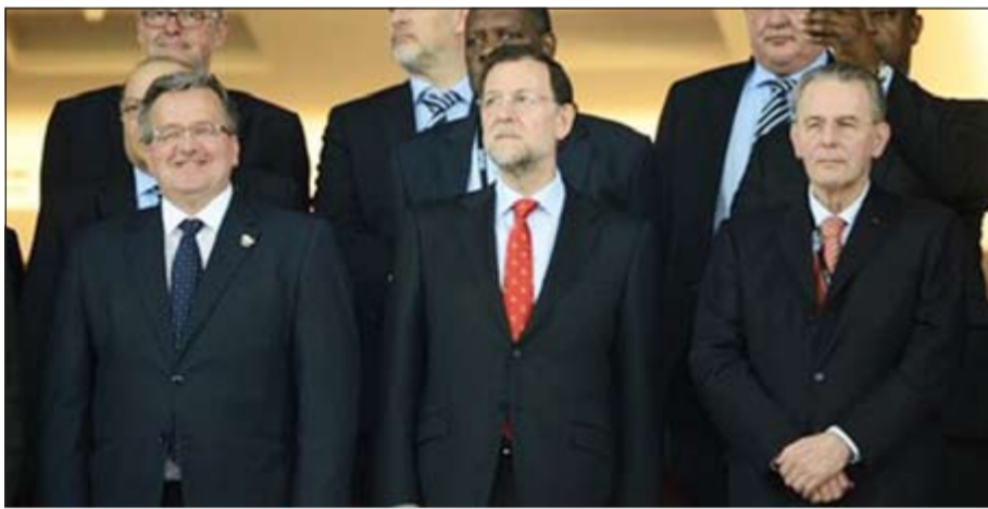
رئيس اللجنة الأولمبية الدولية جاك روغ مع رئيس الحكومة الإسبانية ماريانو راخوي

بحث رئيس اللجنة الأولمبية الدولية جاك روغ مع رئيس الحكومة الإسبانية ماريانو راخوي مؤخراً وضع الاقتصاد في البلد الأوروبي وتأثيره على ملف ترشح مريد لاستضافة دورة الألعاب الأولمبية 2020. وقال روغ في مقابلة بلوزان، مقر اللجنة الأولمبية الدولية «لقد التقيت مع السيد راخوي في نهائي بطولة أمم أوروبا في كيبف وناقشنا ذلك»، وتصادف وجود كل من روغ وراخوي في كيبف، حيث فازت إسبانيا يوم الأحد الماضي على إيطاليا 4-0 لتحصد بطولة الأمم الأوروبية للمرة الثالثة في تاريخها، وأوضح له رئيس الحكومة الإسبانية كل نقاط القوة في الدوري الإسباني مع كل من طوكيو واسطنبول على شرف الفوز باستضافة