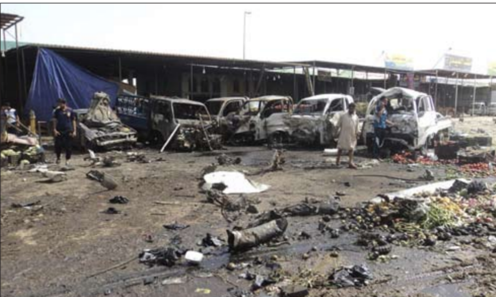
جانب من الدمار الذي أحدثته الهجوم في الديوانية

بغداد - أ.ف.ب: قتل 36 شخصا على الأقل وأصيب حوالي 100 بجروح في سلسلة هجمات شنهتها مناطق مختلفة من العراق أمس أبرزها انفجار شاحنة مفخخة داخل سوق مكتظ وسط الديوانية، كما أفادت مصادر أمنية وطبية عراقية. وقال ضابط في الشرطة في الديوانية برتبة عقيد لـ «فرانس برس» طلباً عدم كشف اسمه ان 25 شخصاً قتلوا وأصيب ما لا يقل عن 70 آخرين بجروح في انفجار شاحنة مفخخة داخل السوق الرئيسي وسط مدينة الديوانية». وأضاف ان «الانفجار وقع حوالي العاشرة والربع صباحاً عندما كان السوق وهو الرئيسي لبيع الخضار في المدينة، يشهد زحاما شديدا».