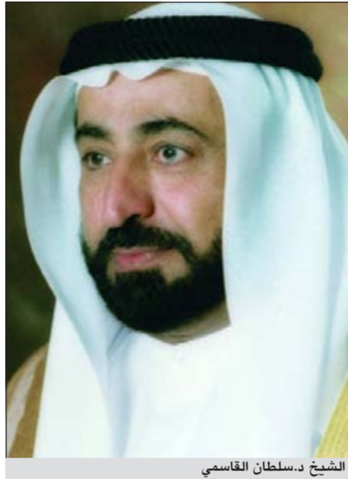
الشيخ د.سلطان القاسمي

وجه الشيخ د.سلطان بن محمد القاسمي عضو المجلس الأعلى حاكم الشارقة باقتناء مجموعة مختارة من الأعمال الفنية المحلية بقيمة مليون درهم والتي شاركت في المعرض السنوي العام في دورته الـ 30 الذي نظمته جمعية الإمارات للفنون التشكيلية، وذلك دعماً منه للفنان المحلي والارتقاء بالحراك الفني في دولة الإمارات العربية المتحدة.