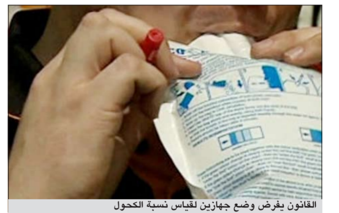
القانون يفرض وضع جهازين لقياس نسبة الكحول

تحذير بالسوان عالية الوضوح (فسفورية). وتطبيق الاشتراطات الجديدة أيضاً على السائقين الأجانب في فرنسا، مع ان هناك مهلة في تطبيق الفرض الشامل للقانون تستمر حتى نوفمبر المقبل. ويقتل في فرنسا سنوياً نحو 4000 شخص في حوادث الطرق، وتعد قيادة السيارات تحت تأثير الكحول العامل الرئيسي وراء هذه الحوادث، وتتقدم حتى على قيادة السيارات بسرعة مفرطة. وتأمل السلطات الفرنسية بأن يدفع وجود جهاز قياس نسبة الكحول في الجسم في كل سيارة من يشك في قيادتهم السيارة تحت تأثير الكحول إلى اجراء