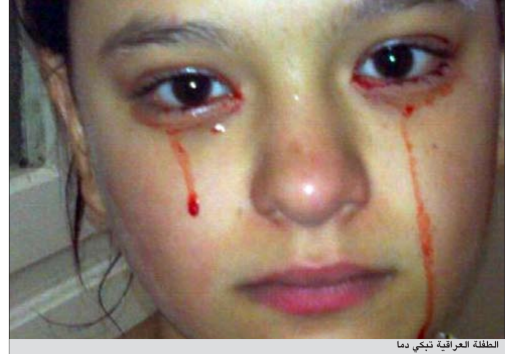
الطفلة العراقية تبكي دماً

مكة المكرمة - وكالات: وجه والد طفلة عراقية تبلغ من العمر 12 عاماً نداءً إلى وزير الصحة السعودي د. عبدالله الربيعية والخيرين ونوبي القلوب الرحيمة مساعدته في علاج ابنته بالمدينة الطبية. ووفق المناشدة التي نقلتها صحيفة الوثام الإلكترونية ان الطفلة حضرت مع والدها لأداء