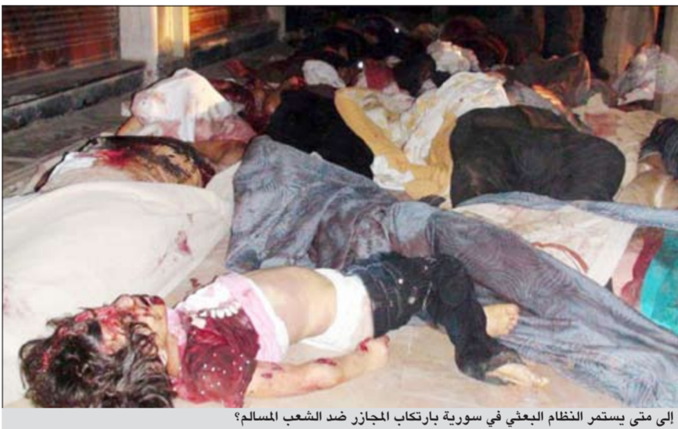
إلى متى يستمر النظام البعثي في سورية بارتكاب المجازر ضد الشعب المسلم؟

جاء الخطاب القرآني ليقرر حرية إبداء الرأي وحق نقد السلطة كما جاء في حديث البيعة الصحيح «وإن نقول أو نقوم بالحق حيثما كنا لا نخاف من الله لومة لائم» وحديث «دعوه فإن لصاحب الحق مقالا»، وحديث «أفضل الجهاد كلمة حق عند سلطان جائر»، وجاء الخطاب السلطاني ليقرر مبدأ تحريم