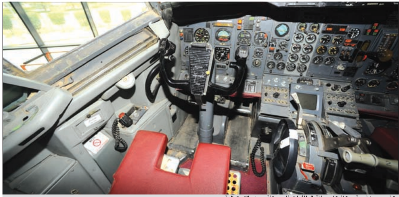
تخصص مهندسة ميكانيكا صيانة الطائرات نادر ونفرد به "الأسترالية"

هل تشتترط الكلية دفع الرسوم الدراسية مرة واحدة أم هناك خيارات بالدفع؟ ● هناك خيارات في الدفع يمكن للطلاب الدفع عن طريق نظام الإقساط كما أن الكلية تراعي بعض حالات الطلبة الذين يعانون صعوبات مادية فهناك نظام التقسيط على الأقسام وهو نظام مريح على الدفع وتناخذ بعين الاعتبار كافة الحالات الإنسانية.