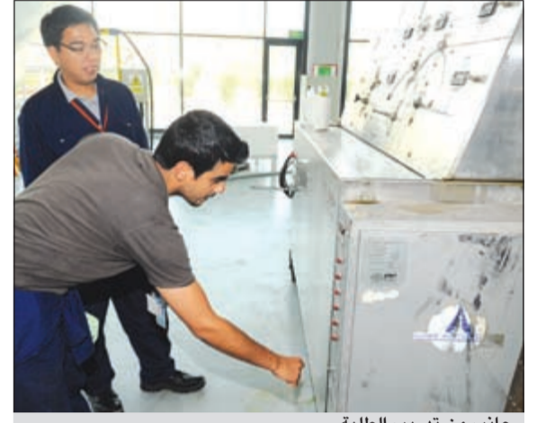
جانب من تدريب الطلبة

كما ان وزارة التعليم العالي ترسل طلبه كويتيين وفقا لنظام البعثات الخارجية الى تلك الجامعات التي تجمعا بها شراكة.