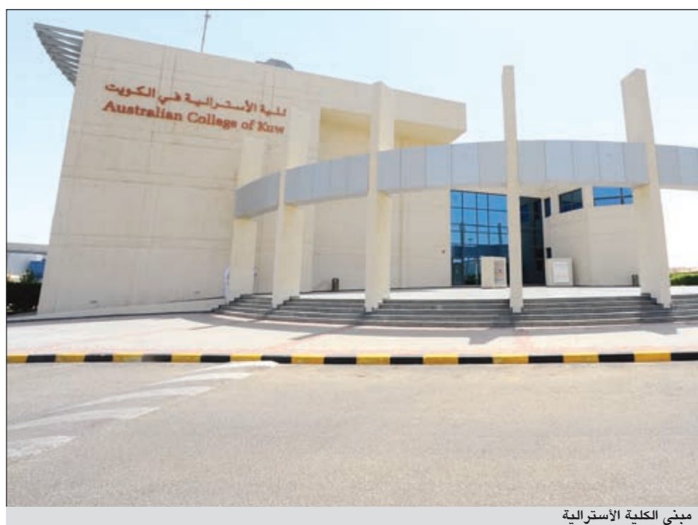
مبنى الكلية الأسترالية

بالإضافة إلى ان الكلية توفر بعثات داخل الكلية للطلبة المتقنين غير الكويتيين كما