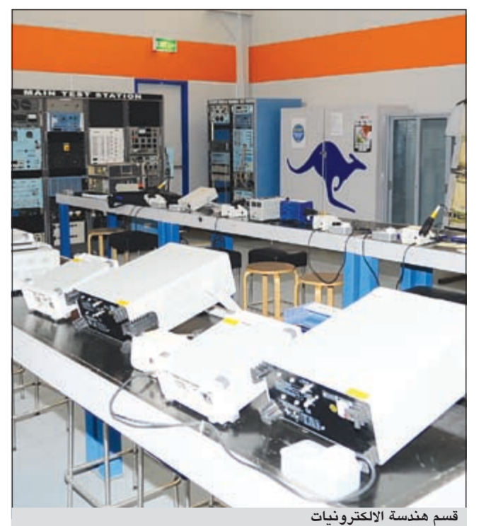
قسم هندسة الالكترونيات

لدينا 3 كليات رئيسية هي إدارة الأعمال والهندسة والطيران ونعزم فتح تخصص هندسة إدارة منشآت الطيران في فبراير 2013 بالإضافة إلى الهندسة الإنشائية والهندسة البيئية