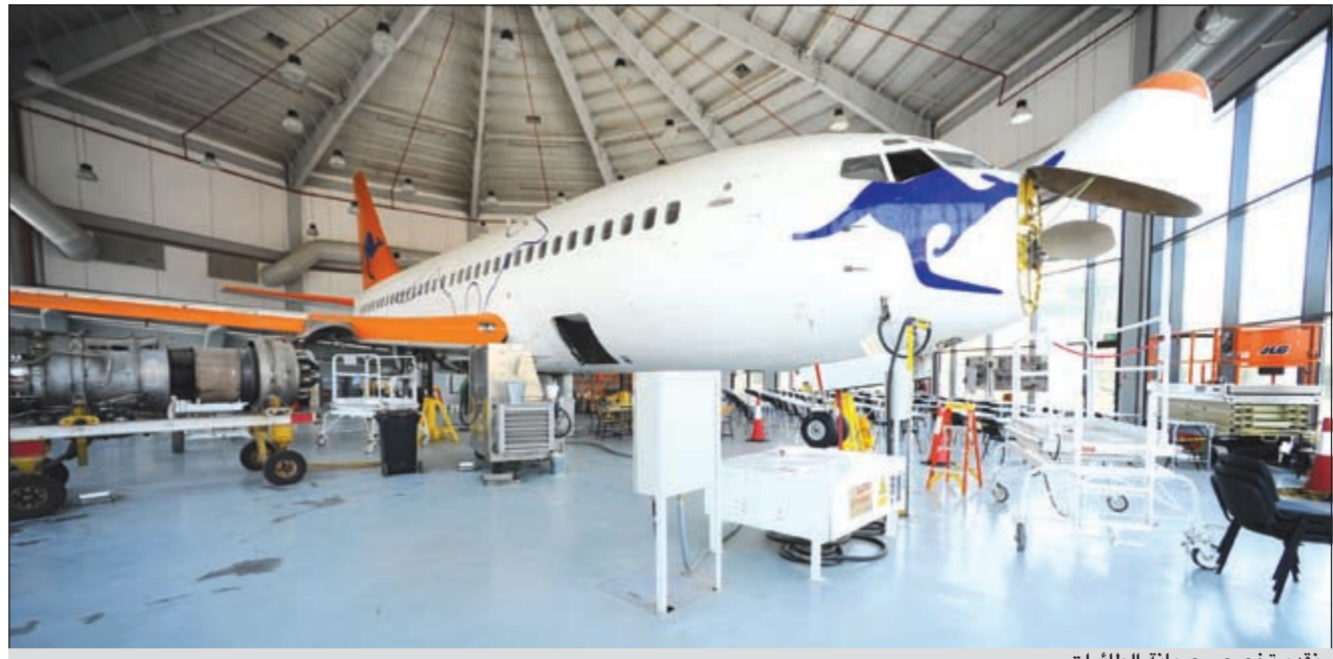
تقدم تخصص صيانة الطائرات

● قسم الملاحة البحرية يختص بجميع جوانب الملاحة البحرية وتطبيقاتها والدورات المختصة بتطوير كل ما توصلت إليه تكنولوجيا الملاحة البحرية، وقد استخدمت الكلية نموذجاً محاكياً للواقع يجعل الطالب يتدرب على الملاحة البحرية وكأنه متواجد بالبحر، فعلى سبيل المثال يتم عمل عاصفة بحرية وظروف بحرية لتوضيح طريقة الاتصال بين إدارة الملاحة مع القطاعات الداخلية في حال حدوث كوارث وبالتالي فهناك تعاون بين الكلية الأسترالية مع الجهات المختصة بخفر السواحل في وزارة الداخلية وفي الملاحة البحرية لعمل دورات متخصصة في الملاحة البحرية.