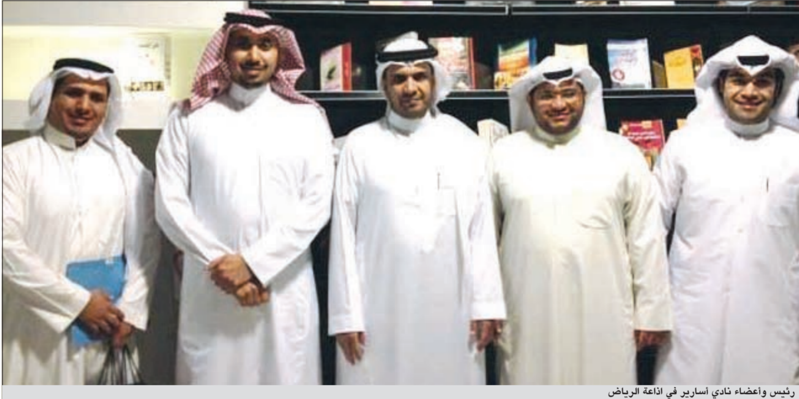
رئيس وأعضاء نادي أسارير في إذاعة الرياض

مشرفة نادي أسارير على تذليل المعوقات وتشجيعهم لنا لإقامة هذا النشاط، والشكر موصول لإدارة حساب الجليس بتويتر على دعمهم الإعلامي لنا طوال مدة الرحلة.