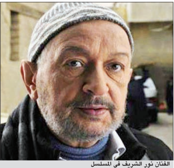
الفنان نور الشريف في المسلسل

«عرفة البحر» تأليف محمد الصفتي، إخراج أحمد مدحت، بطولة نور الشريف، دلال عبدالعزيز، ثرمنين ماهر، وآخرون، عدد الحلقات 30 حلقة.