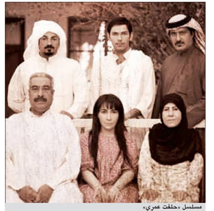
مسلسل «حلفت عمري»