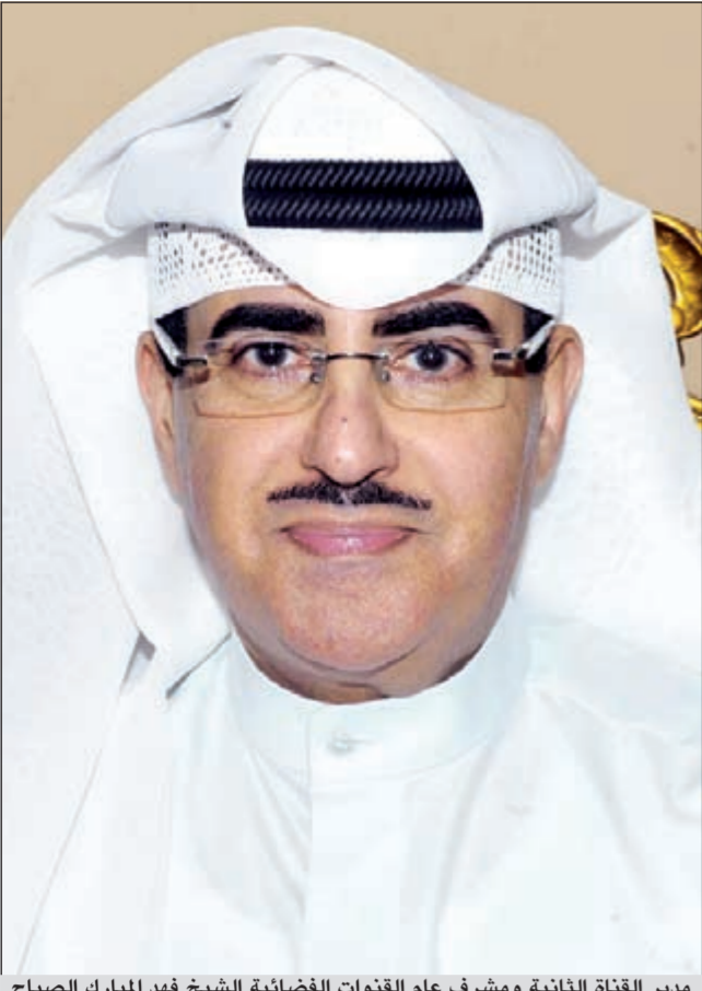
مدير القناة الثانية ومشرف عام القنوات الفضائية الشيخ فهد المبارك الصباح