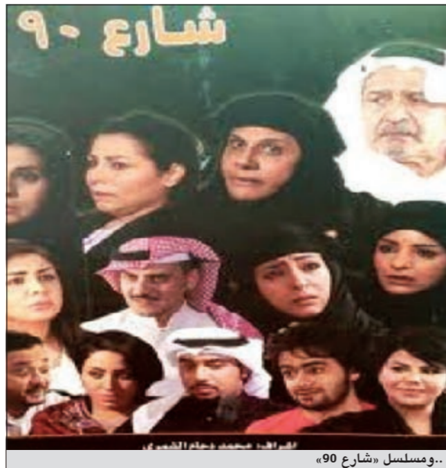
..ومسلسل «شارع 90»

من جانبه أكد وكيل التلفزيون علي الرئيس في كلمته