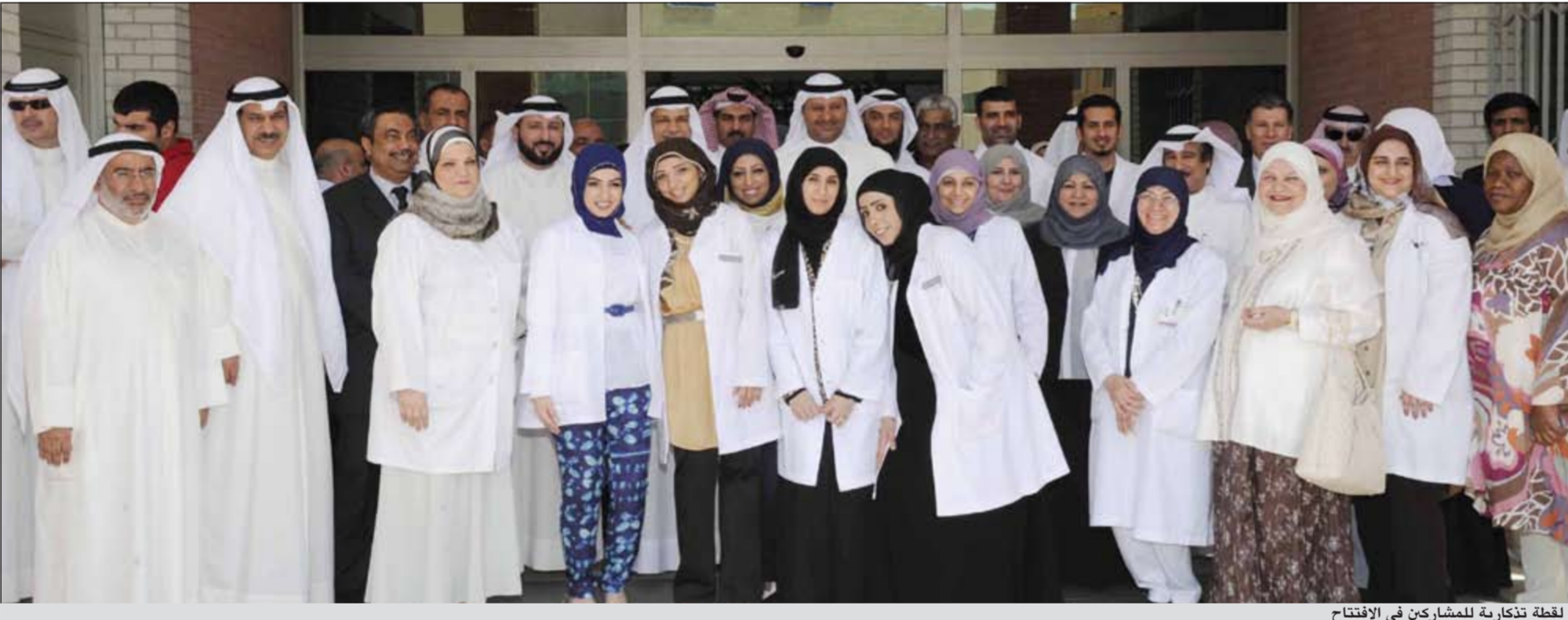
لقطة تذكارية للمشاركين في الافتتاح

والتأهيل للمسنين من سن 65 فما فوق، وموضحاً أن المسح الصحي لكبار السن سيضم جميع المناطق الصحية، كما أفاد بأنه تم تخصيص نوافذ خاصة لصراف الأدوية لكبار السن ضمن البرنامج الوطني لكبار السن، واختتم موجهاً الشكر لجميع من شارك في إنجاز مركز الشهداء الصحي.