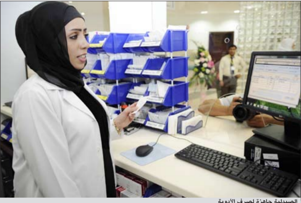
الصيدلية جاهزة لصراف الأدوية