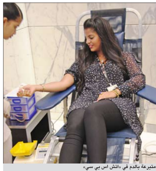
متبرعة بالدم في «اتش اس بي سي»