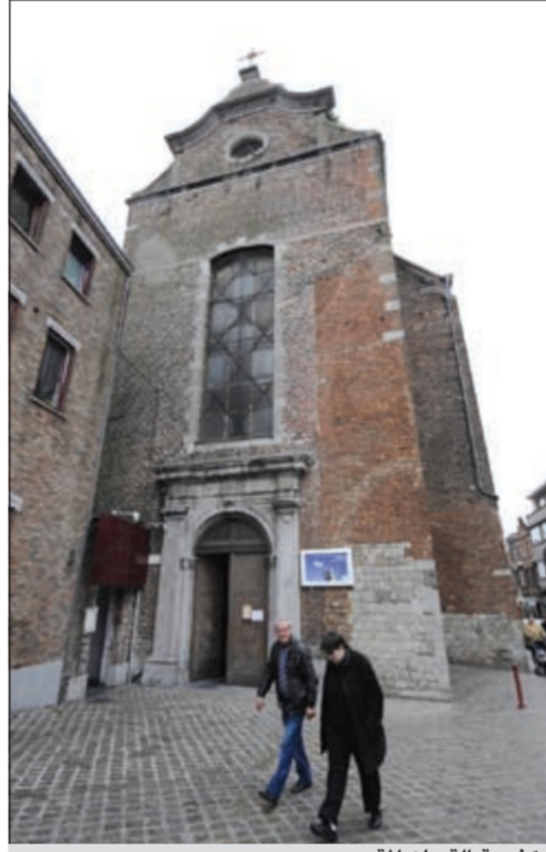
كنيسة القربان المقدس