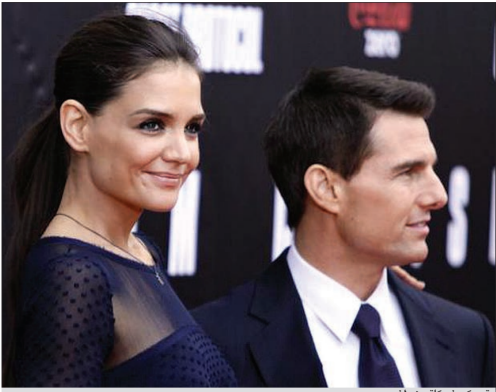
توم كروز وكاتي هولمز

المثلة كاتي هولمز تتعرض للمراقبة على مدار الساعة من جانب رجال غرباء. وذكر موقع «تي أم زد» الاخباري المعني بأخبار المشاهير أنه تم رصد سيارتين على متنها رجال غرباء يراقبون هولمز ما أثار تكهنات بأنهم ربما ينتمون لطائفة السيانتولوجيا. ومع ذلك قال محامي كنيستة جاري سوتير للموقع إن طائفة السيانتولوجيا «لا تراقب أو تتابع كاتي قسي أعقاب طلبها الطلاق من الممثل توم كروز». وقد تردد أن كاتي تتعرض للمراقبة منذ أسابيع قبل إعلانها طلب الطلاق من توم، ويذكر أن كاتي طلبت الطلاق من توم الجمعة الماضية بعد زواج دام خمسة أعوام. وتردد أن كاتي اتخذت هذه الخطوة بسبب سيطرة توم على حياتها وتدخله في اختياراتها لادوارها بالإضافة إلى خوفها على ابنتهما سوري من طقوس طائفة السيانتولوجيا التي يعتنقها توم.