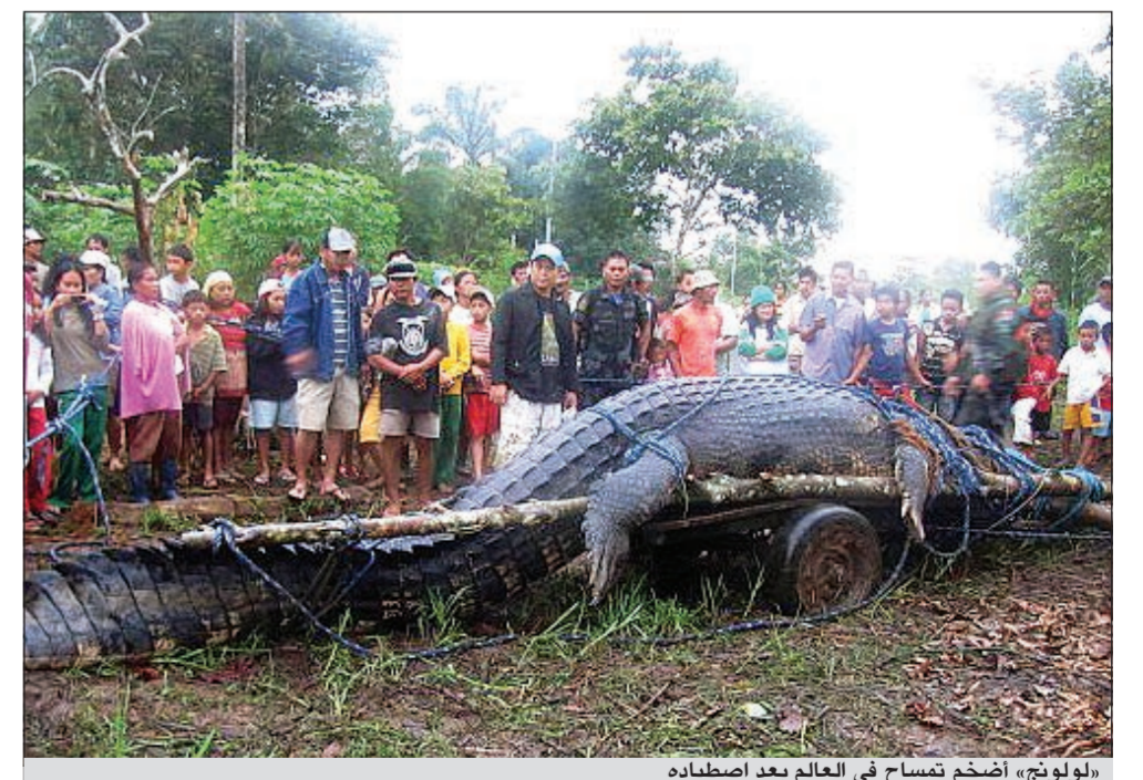
«لولونج» أضخم تمساح في العالم بعد اصطياده

مانيل - أ.ش.: أعلن إدوين كوكس إيلوردي عمدة بلدة بوناوان بإقليم أجوسان ديل سور جنوبي الفلبين أنه تلقى إخطارا من موسوعة غينيس للأرقام العالمية يفيد بإدراج التمساح «لولونج» بالموسوعة وحصوله على لقب أضخم تمساح في العالم. وأوضح العمدة وفقا لوسائل إعلام محلية أن التمساح الذي يعيش في المياه المالحة ويزيد طوله على 6 أمتار ووزنه عن طن، مسؤول عن