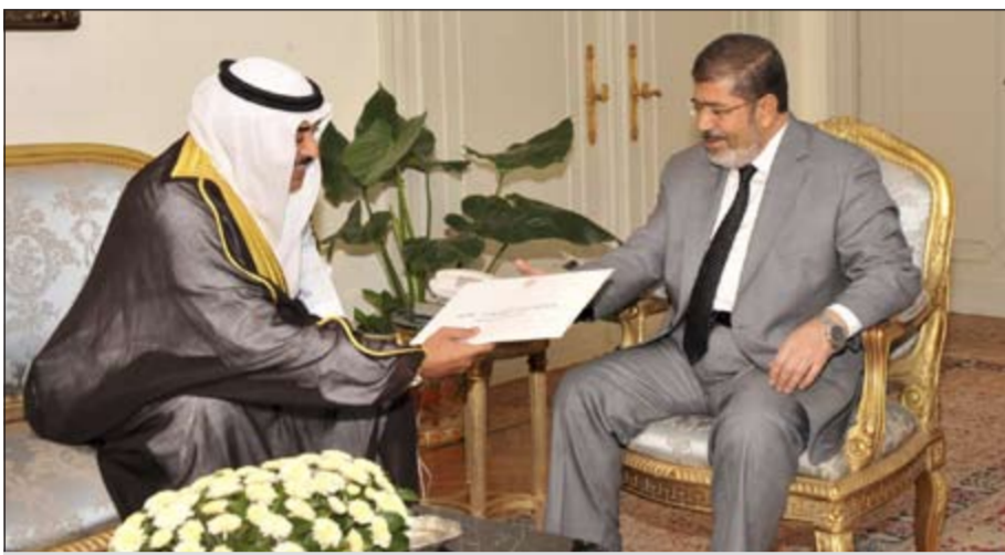
الرئيس محمد مرسي يتسلم رسالة صاحب السمو من الشيخ صباح الخالد

القاهرة - كونا: اجتمع نائب رئيس مجلس الوزراء ووزير الخارجية ووزير الدولة لشؤون مجلس الشيخ صباح الخالد امس الى رئيس جمهورية مصر العربية د.محمد مرسي حيث سلمه رسالة خطية من أخيه صاحب السمو الأمير الشيخ صباح الأحمد. وقال الشيخ صباح الخالد في تصريح له «كونا» عقب الاجتماع أنه نقل رسالة من صاحب السمو الأمير الشيخ صباح الأحمد الى الرئيس المصري د.محمد مرسي من خلال سفراء مصر العربية. وتضمن الإشادة بالعلاقات التاريخية المميزة إذ أن هذه العلاقات تتطلب التشاور والتباحث بين البلدين في كل القضايا الثنائية والقضايا الإقليمية والدولية التي تهم البلدين. وذكر الشيخ صباح الخالد أنه تم توجيه دعوة رسمية الى الرئيس المصري د.محمد مرسي من صاحب السمو الأمير الشيخ صباح الأحمد لزيارة الكويت الدائم لدى جامعة الدول العربية السفير جمال الغنيم. يذكر أن الشيخ صباح الخالد يزور مصر حاليا لحضور اجتماع المعارضة السورية تحت رعاية جامعة الدول العربية.