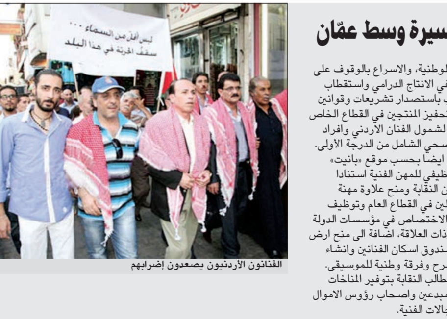
الفنانون الأردنيون يصعدون إضرابهم