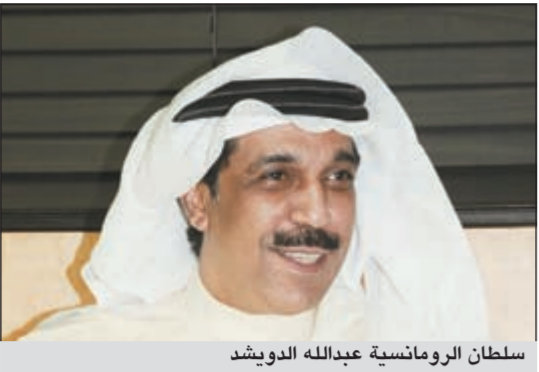
سلطان الرومانسية عبدالله الرويشد

يقول سلطان الرومانسية عبدالله الرويشد والفنانة اللبنانية ميريام فارس المشاركة في مهرجان تيمقاد الدولي الممتد من 7 إلى 14 الجاري، اكتملت الاسماء الفنية التي ستطرح في سماء المهرجان في دورته الرابعة والثلاثين في مدينة باتنة (550 كيلومترا شرق العاصمة الجزائرية)، للاحتفال بالذكرى الخمسين لاستقلال الجزائر. وأوضح المدير العام للديوان الوطني للثقافة والإعلام الجزائري لخضر بن تركي، بحسب موقع «نابا الوطن»، أن النجوم العرب الذين سيشاركون في المهرجان هم: سلطان الرومانسية عبدالله الرويشد، نجاة عتابي من المغرب، وفرقة ماجيك سيستم وسون كيتي من نيجيريا، وميريام فارس من لبنان، وصوفيا صادق من تونس. وتحققي الدورة الرابعة والثلاثون بالذكرى الخمسين لاستقلال الجزائر من خلال حفل الافتتاح، الذي ستشارك فيه الأوركسترا السيمفونية برفقة نخبة من الفنانين الجزائريين من جيل الاستقلال. ويشارك إلى جانب النجوم العرب حوالي 30 فنانا وفرقة فنية، وستكون السهرة الختامية مع الرويشد برفقة المطربين الجزائريين راجع عصمة وكادير الجابوني وحكيم الباتني والشاب عراس.