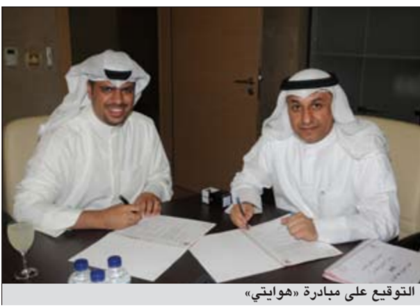
التوقيع على مبادرة «هوايتي»

ويرحب المشروع الوطني للشباب بجميع الأراء البناءة حول هذا المشروع ويدعو جميع الكويتيين المهتمين بالمشروع الشبابي إلى تقديم المبادرات والمقترحات في مختلف المجالات كالإقتصاد والتعليم والإسكان والصحة والبيئة والفنون والآداب والرياضة والعمل التطوعي والقانون وتعزيز المواطنة والممارسة الديمقراطية وغيرها.