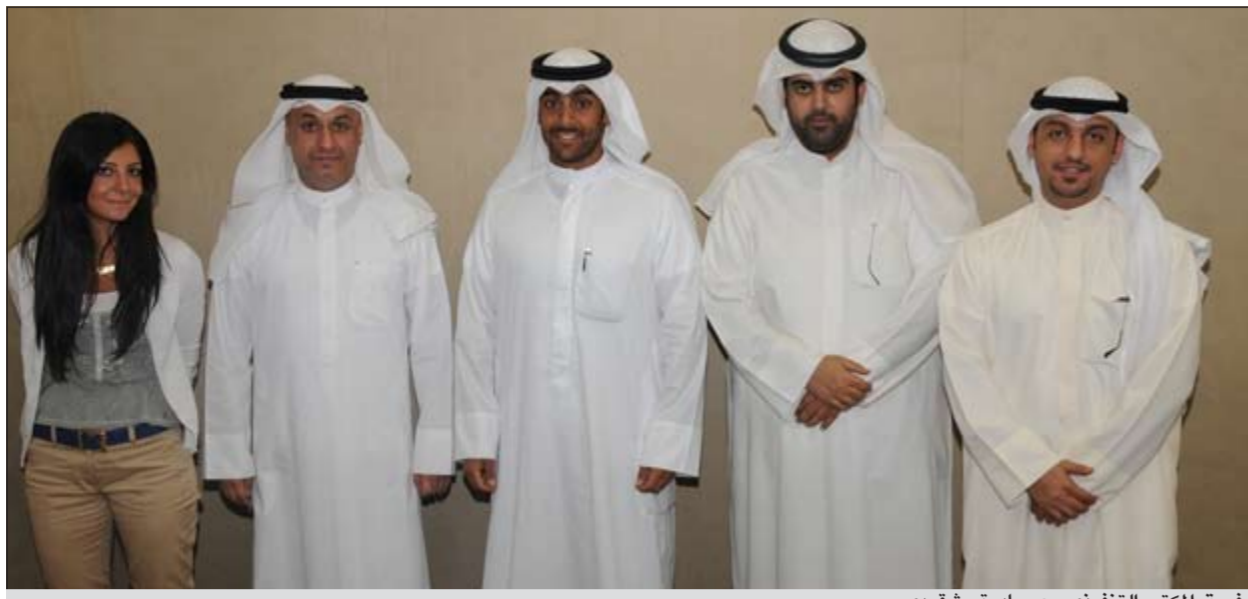
فريق المكتب التنفيذي مع مبادرة «شقردي»