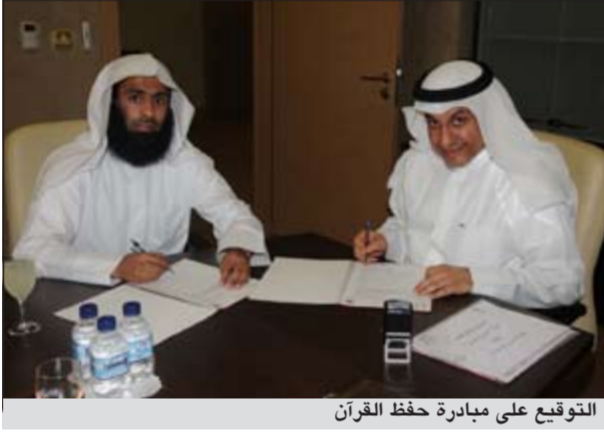
التوقيع على مبادرة حفظ القرآن