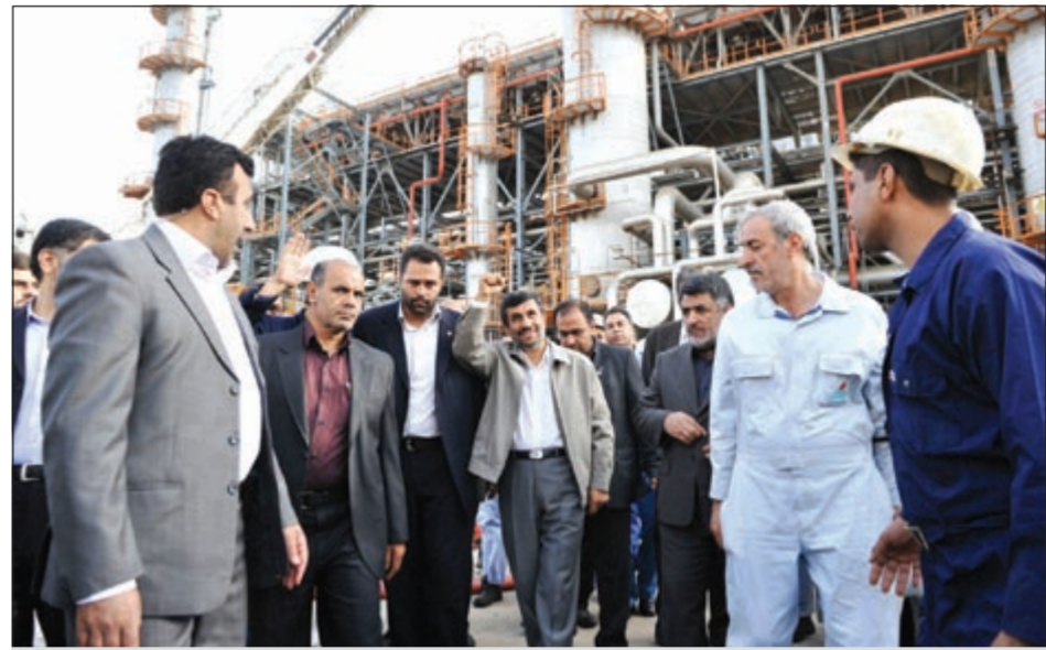
صورة أرشيفية للرئيس الإيراني في مصفاة للنفط في عبادان

طهران - كونا: أعلن وزير النفط الإيراني رستم قاسمي أمس ان إيران على أتم الاستعداد لمواجهة العقوبات النفطية الأوروبية الأخيرة. وقال قاسمي في تصريح نقلته وكالة الأنباء الرسمية الإيرانية (ارنا) ان «النفط الإيراني له أسواقه وان الحكومة الإيرانية أخذت بعين الاعتبار كافة الخيارات المحتملة وهناك استعدادات تامة لمواجهة الموقف».