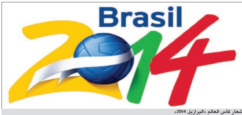
شعار كأس العالم «البرازيل 2014»