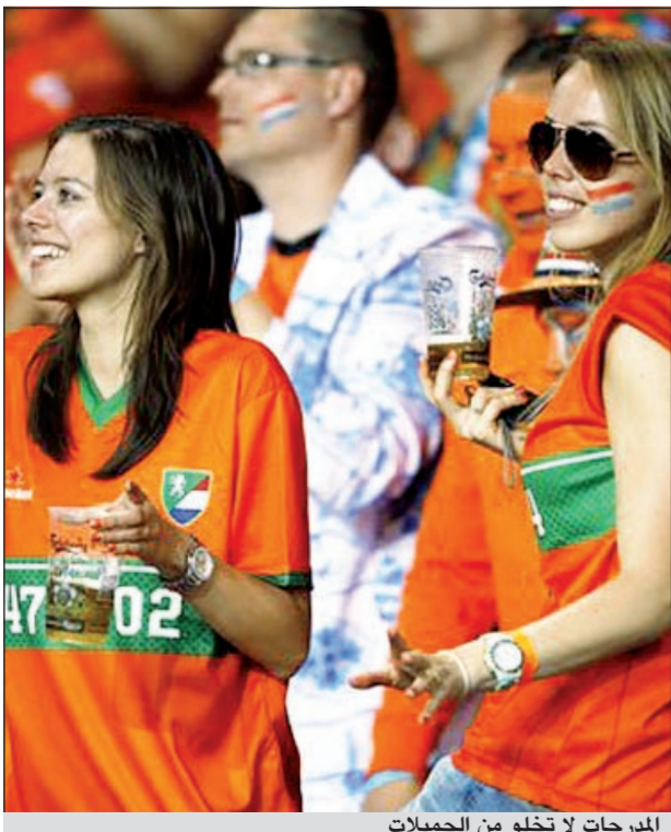
المرجات لا تخلو من الجميلات