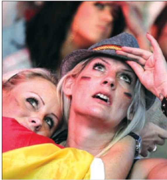
المانية تبكي عقب هزيمة «المانشافت» أمام إيطاليا

شنت وسائل الإعلام الألمانية هجوما عنيفا على مخرج مباراة المانشافت أمام إيطاليا والتي انتهت بفوز الأخير بهدفين مقابل هدف في نصف نهائي يورو 2012. وأشارت صحيفة بيلد الألمانية التي أن مخرج المباراة قاسم بـ «فكرة» لحظة مؤثرة خلال المباراة عندما تم عرض لقطة لمنشعبة المانية وهي تبكي عقب الهدف الثاني للمهاجم الإيطالي ماريو بالوتيلي، حيث أكدت الصحيفة الألمانية أن تلك اللقطة غير سليمة، وأنها كانت قبل انطلاق المباراة، وتم بثها عقب الهدف لاجتباب الألمان. من جانبها نفت السيدة التي ظهرت تبكي خلال المباراة قيامها بذلك، وأرسلت بريدا إلكترونيا إلى صحيفة بيلد أكدت فيه أنها ادعت قبل المباراة بسبب حماسها الشديدة في ذلك الوقت، ولم تبك خلال سير اللقاء. واعترف الاتحاد الأوروبي بأن اللقطة لم تبث في وقتها الصحيح، وأكد «يويفا» أن قرار بث اللقطات خلال المباراة يرجع للشركة التلفزيونية التي تتولى تلك المهمة، وأن الاتحاد غير مسؤول عن ذلك، نائفا أن يكون بث تلك اللقطة في هذا الوقتين بنية احتباط الألمان عقب تأخر فريقهم بهدفين في الشوط الأول.