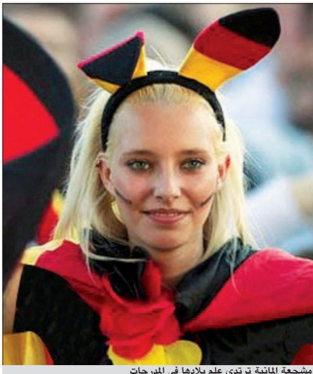
مشجعة المانية ترتدي علم بلادها في المدرجات