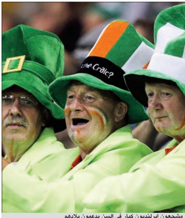
مشجعون إيرلنديون كبار في السن يدعمون بلادهم