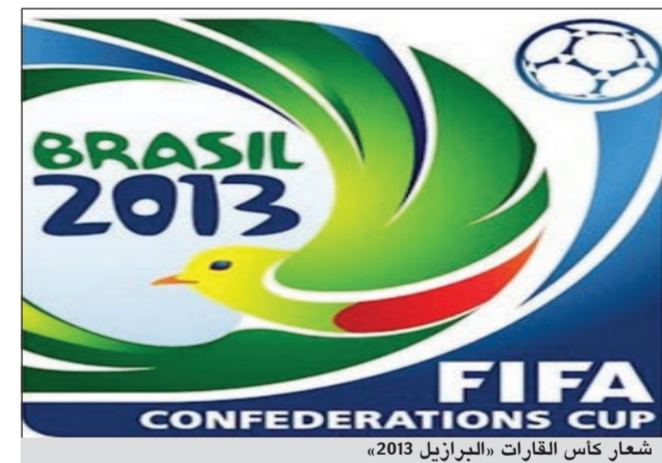
شعار كأس القارات «البرازيل 2013»

ويبدو أن تسوية بعض الأمور مثل المشاهدة العامة وبيع الجعة في الاستادات اقتربت من الحسم. وتقام كأس العالم 2014 في 12 مدينة برازيلية والمسافة بينهم أبعد من السفر بين بولندا وأوكرانيا في يورو 2012، وتبعد ساو باولو عن ماناوس أربعة آلاف كيلومتر مما يتطلب السفر عبر الطائرة وذلك فأت إلى الأوربيين مع استمرار بطولة كأس الأمم الأوروبية في الملاعب. وفي الوقت الذي نقلت فيه جميع قنوات العالم المباراة النهائية ليورو 2012 أمس الأحد إلى إيطاليا وإسبانيا.. وانشغلت الصحف العالمية بأفعال فرناندو توريس وماريو بالوتيلي وكريستيانو رونالدو.. فإن الأنظار كلها في البرازيل توجه صوب المباراة النهائية لكأس ليبرتادورس، التي تجمع بين كورينثيانز البرازيلي وبوكا جونيورز الأرجنتيني يوم الخميس المقبل.