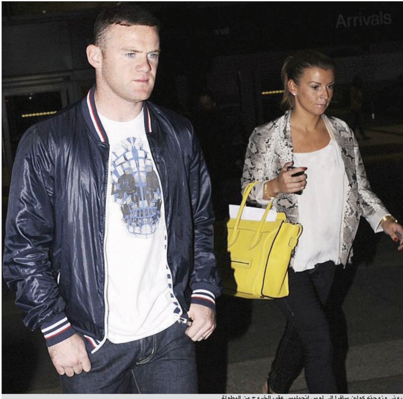
روني وزوجته كولين سافرا إلى لوس أنجيليس عقب الخروج من البطولة

يبدو أن مهاجم إنجلترا واين روني لا يريد أن يدخل في نقاشات محتدمة بعد إقصاء بلاده من يورو 2012، فبعد أيام قليلة من عودة منتخب إنجلترا من البطولة، شوهد نجم مان يونايته روني يسترخي في بركة للسباحة في فندق لوس أنجيليس مع زوجته كولين. ووجد روني نفسه وسط حرب كلامية خلال هذا الأسبوع، عندما التقى المدير الفني السابق لإنجلترا فابيو كابيللو اللوم على روني لخروج إنجلترا من البطولة، مؤكدا أن المهاجم يلعب بشكل جيد فقط مع مان يونايته وليس بلاده. إذ نقلت وسائل الإعلام البريطانية عن الإيطالي قوله: «بعد مشاهدة المباراة الأخيرة (بين إنجلترا وإيطاليا) اعتقد أن روني لا يفهم غير الإسكوتلندية، هذا لأنه يلعب فقط بشكل جيد في مسان يونايته حيث أن المدير الفني السير الكيس فيرغسون اسكوتلندي». وربما كان كابيللو يشعر بالضيق بسبب اقتراحات سابقة لروني عندما قال إن بعض وسائل وأحاديث كابيللو التكتيكية قد «ضاعت أثناء الترجمة»، نظرا إلى محدودية اللغة الإنجليزية عند الإيطالي عندما كان يقوم بإدارة منتخب إنجلترا. وأيا كان السبب، فإنه كان هناك شخص واحد صدم من الانتقادات السلبية ل أداء إنجلترا في يورو 2012، هو المدير الفني الجديد روي هودجسون الذي اعتمد طريقة دفاعية بحثة بدلا من الهجوم، والذي اعتقد بأن لكابيللو كل الحق أن يبدي بآرائه ولكنها كانت آراء رخيصة قليلا