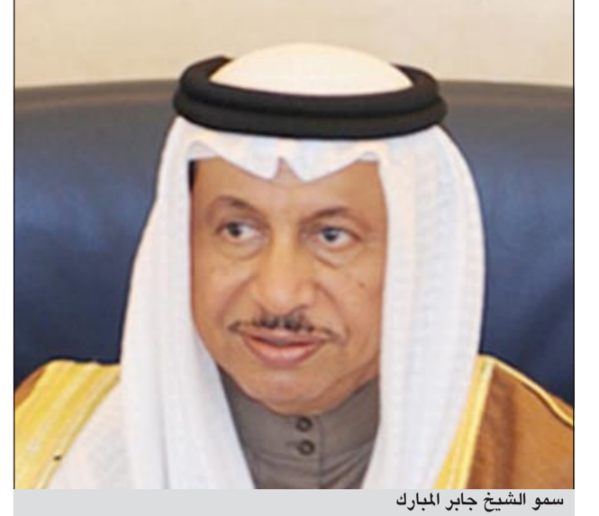
سمو الشيخ جابر المبارك