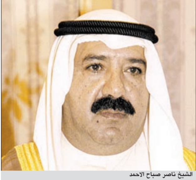
الشيخ ناصر صباح الاحمد

أتقدم بكتابتكم الى سيادتكم راجيا التكرم بالنظر بعين العطف والموافقة على منحي احد البيوت التابعة للديوان الاميري في منطقة الجهراء حيث انني كويتي الجنسية ولدي طلب اسكاني 2003 ولم اتمكن من الحصول على بيت مع العلم انني اعاني من اعاقة حركية واسكن حاليا في شقة ايجار انا وعائلتي.. وليس لدي القدرة المالية على شراء منزل، لذلك ارجو من الله ومنكم العون والمساعدة ومدت لنا ذنرا وانت اهلا للعون والمعروف وجعله الله في ميزان حسناتك ونحن مقبلين على شهر رمضان المبارك.