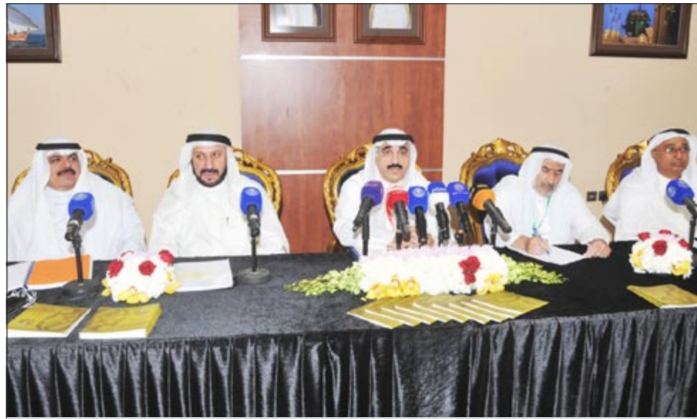
جانب من المؤتمر الصحافي (متن غوزال)