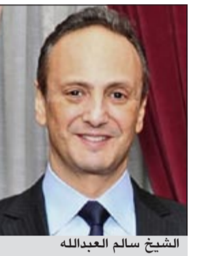
الشيخ سالم العبدالله

وبين «ان الجانب الأمريكي أكد ان اسقاط التهم عن فايز الكندري هو مجرد اجراء تقني خاص في بلوائح وزارة الدفاع الأميركية