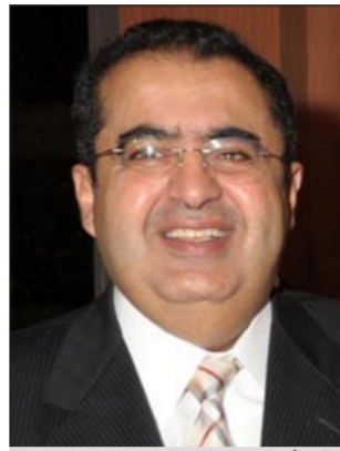
السفير عادل العيار

احتجاجاتهم خلال فترة الصيف. وأضاف ان السفارة الكويتية دأبت على افتتاح المكتب بشكل سنوي لخدمة الأعداد المتزايدة للمصطافين في المنطقة، مشدداً على ان السفارة لن تالو جهداً في تذليل جميع العقبات التي قد تعترض المواطنين الكويتيين وأنهم مستعدون لتقديم كافة الخدمات التي يحتاجونها في البلاد تجريبياً.