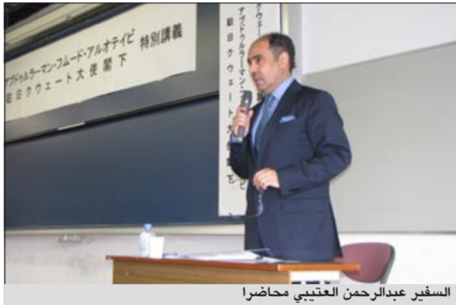
السفير عبدالرحمن العتيبي محاضراً

استعرض العتيبي في محاضرته تاريخ الكويت منذ نشأتها وأول ذكر لاسم الكويت في الخرائط القديمة ومن قبل المؤرخين وكيفية تنظيم السلطة خلال بدايات القرن الثامن عشر وبناء الدولة الحديثة في أواخر القرن التاسع عشر مروراً بمرحلة الاستقلال ووضع الدستور وصولاً الى تاريخنا الحاضر مركزاً بشكل خاص على المبادئ والأسس التي تقوم عليها الكويت وتحديداً الديمقراطية واحترام حقوق الإنسان وصون حقوق المرأة.