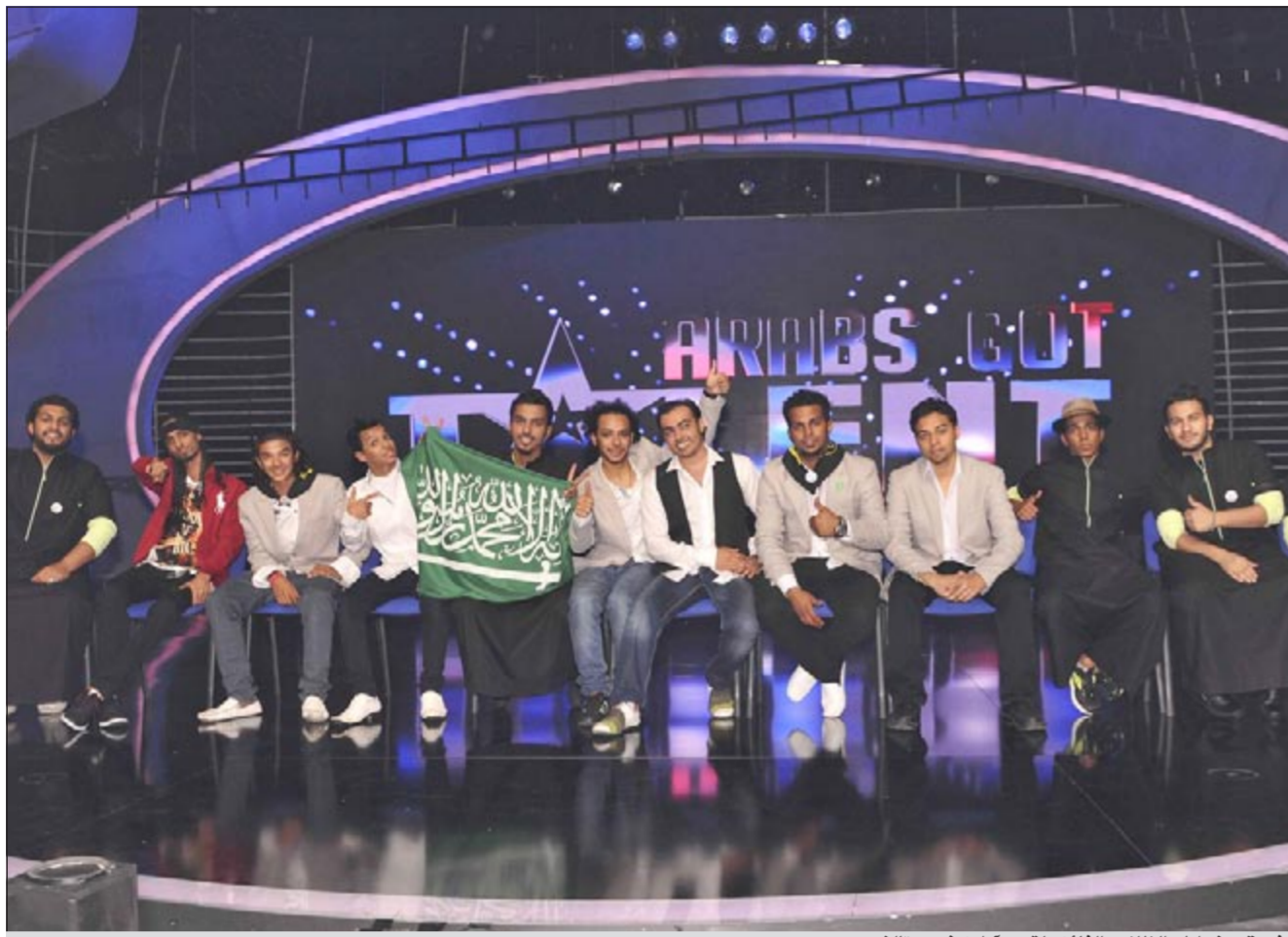
فريق «خواطر الظلام» الفائز بلقب «أرابز غوت تالنت»