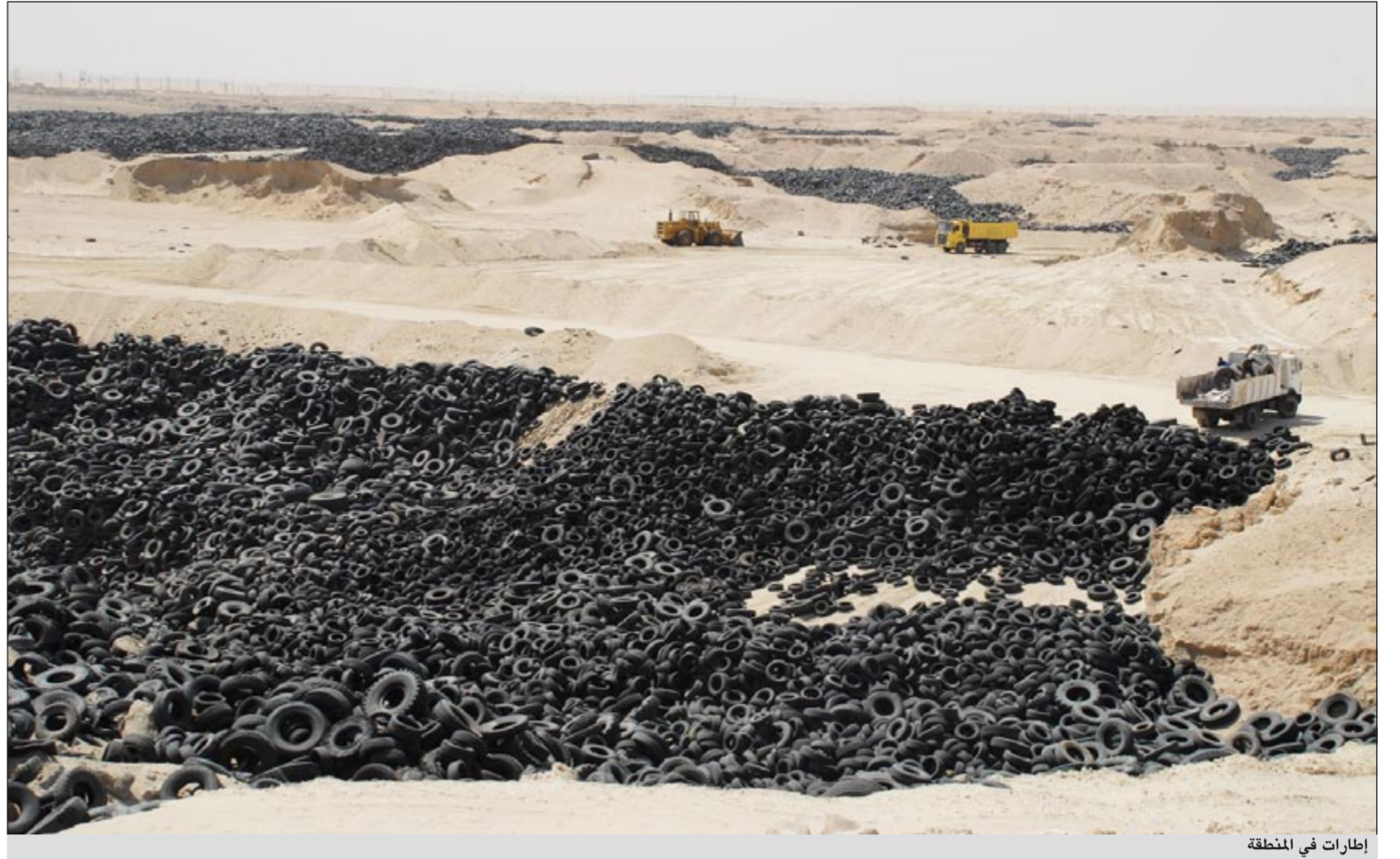
إطارات في المنطقة

وأشار باقر إلى أنه تمت مخاطبة اتحاد الجمعيات وبعض الجمعيات بالتنسيق مع المحافظين في المناطق بهدف تفعيل هذه الحملة لتحديد آلية العمل التي يمكن من خلالها