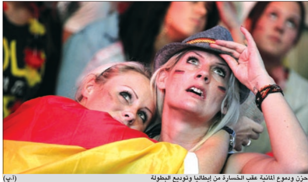
حزن ودموع ألمانية عقب الخسارة من إيطاليا وتوديع البطولة