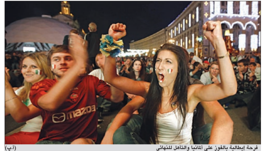
فرحة إيطالية بالفوز على ألمانيا والتأهل للنهائي