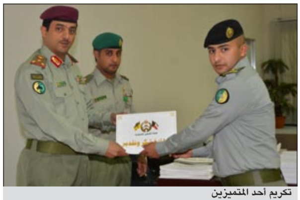
تكريم أحد المتميزين

بجهد وتميز. وأكد قائد الشؤون العسكرية اللواء الركن وليد خالد النوف في كلمة ألقاها نيابة عنه أمر كتائب التعزيز العميد الركن نادر شهبان، حرص القيادة العليا بالحرس الوطني على تكريم المتميزين وتشجيعهم للارتقاء بالمستوى والكفاءة في العمل ومواصلة العطاء ودعا إلى مواصلة هذا الجهد الذي ينعكس إيجابا في خدمة الكويت الغالية ورفعة شأنها.