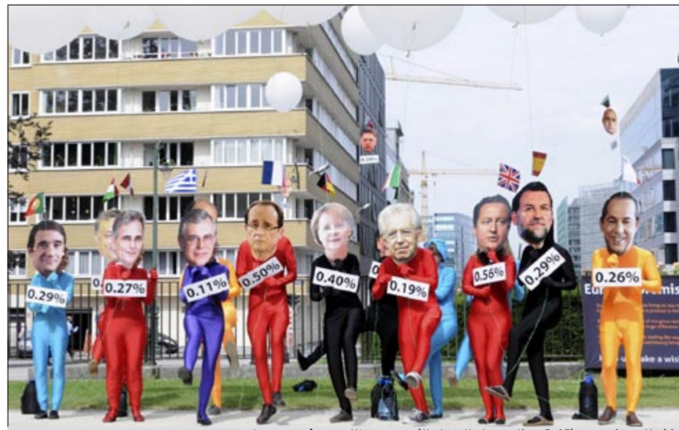
نشطاء متتكرون باقتعة تمثل زعماء الاتحاد الأوروبي يتظاهرون في بروكسل

من ذلك عبر رسم معالم اتحاد اقتصادي فعلي كما ترغب برلين قبل التفكير في المزيد من التضامن مع جيرمانيا. وفي ختام لقاء جمعه مع المستشارية أنجيلا ميركل، أكد الرئيس الفرنسي فرانسوا هولاند أن البلدين متفقان على «تعميق الاتحاد الاقتصادي والنقدي وغدا السياسي». والهدف الأول اقامة وحدة مصرفية تتضمن اشرفا أقوى وضمانات للودائع وآلية مشتركة لحل الأزمات. ويحث صندوق النقد الدولي ومجموعة العشرين القادة الأوروبيين على إنهاء هذا المشروع سريعا ما يمكن أن يؤدي إلى